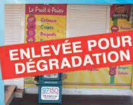
FRUIT A PAIN QUARTIER D'ORLEANS