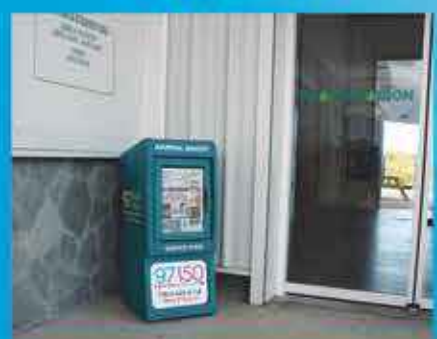
GRAND MAISON HOPE ESTATE