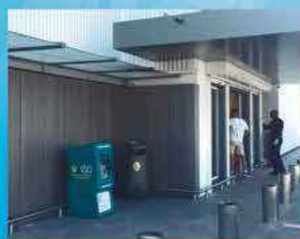
SUPER U HOPE ESTATE