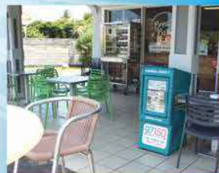
BREAD N'BUTTER OYSTER POND