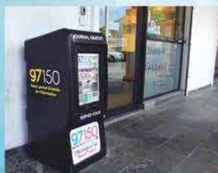
L'EXPRESS HOPE ESTATE