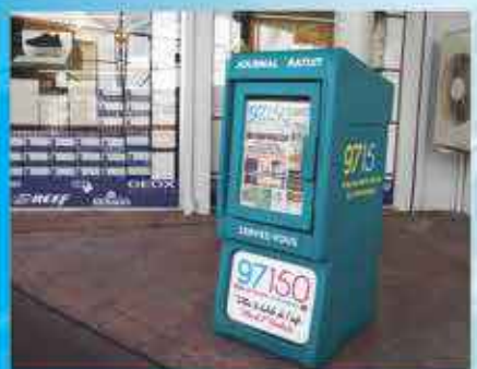
SUPER U HOWELL CENTER