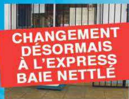
LIBRAIRIE DU BORD DE MER MARIGOT