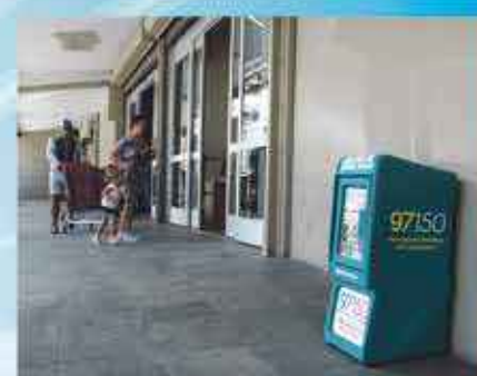
CARREFOUR COLE BAY