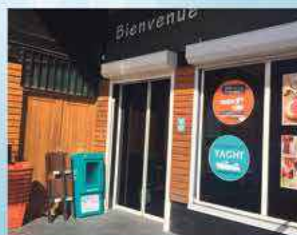
COCCI MARKET CUL DE SAC