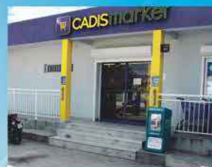
CADISMARKET BAIE NETTLE