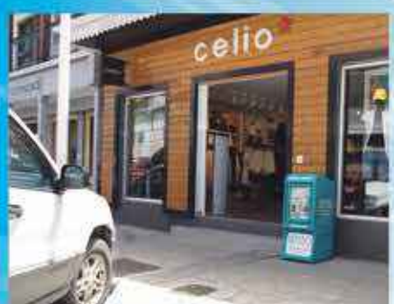
CELIO RUE DU GENERAL DE GAULLE