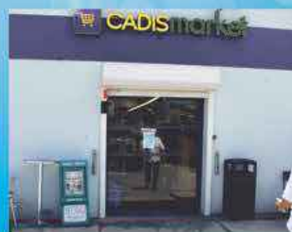
CADISMARKET BAIE ORIENTALE