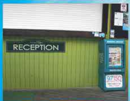
LOTERIE FARM PIC PARADIS