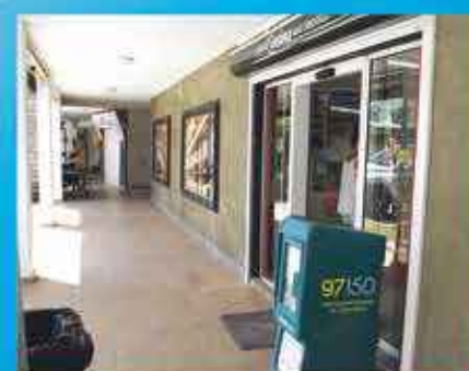
PETIT CASINO BAIE ORIENTALE