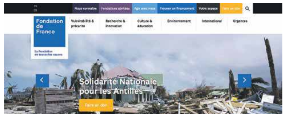
Photo prise au lendemain d'Irma