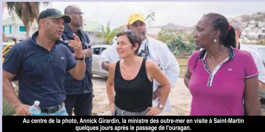
Au centre de la photo, Annick Girardin, la ministre des outre-mer en visite à Saint-Martin quelques jours après le passage de l'ouragan.

Au cours de l'assemblée générale de la Fédération des entreprises d'outre-mer (FEDOM) qui s'est tenue mercredi 27 septembre dernier, la Ministre des outre-mer, Annick Girardin a tenu à rappeler l'actualité marquée par les catastrophes cycloniques dans les Caraïbes.