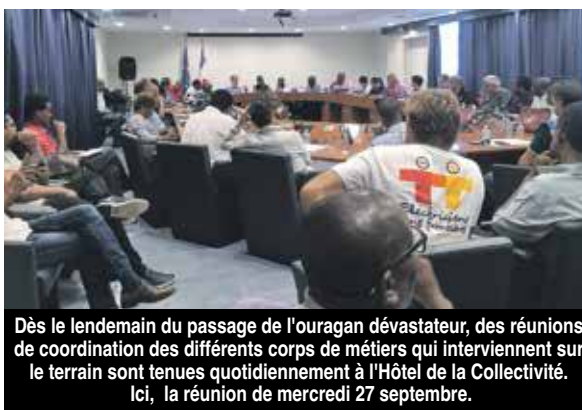
Dès le lendemain du passage de l'ouragan dévastateur, des réunions de coordination des différents corps de métiers qui interviennent sur le terrain sont tenues quotidiennement à l'Hôtel de la Collectivité. Ici, la réunion de mercredi 27 septembre.

La CCISM se charge de l'accompagnement des entreprises : Au