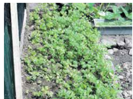
Une belle rangée de persil qui s'offre à la cueillette

Embaucher une animatrice, mettre en place un accueil du public à Cripple Gate, ouvrir un atelier cuisine, créer une banque de graines, tisser des partenariats avec des professionnels du bien-être : cette jeune association, qui compte aujourd'hui une dizaine de membres et cinq bénévoles, fourmille de projets pour poursuivre son aventure. Et ne demande qu'à grandir. De.Gh