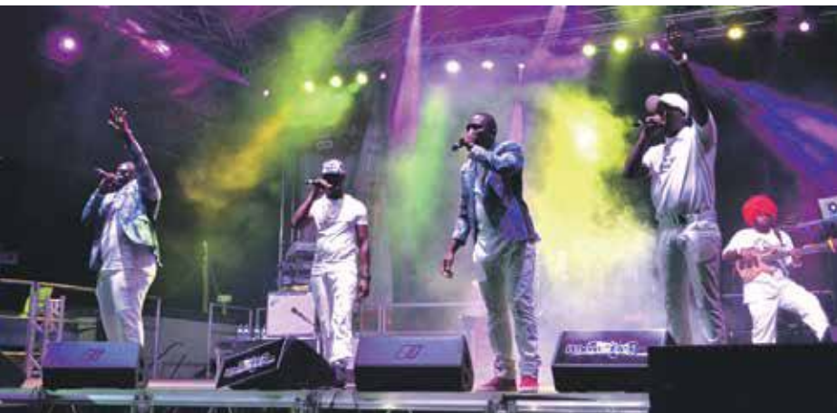
Le Red Eye Crew (R.E.C) a ouvert le bal. Le groupe, composé de quatre jeunes artistes tous originaires de Saint Martin, a entonné ses plus gros succès

sur la scène, et les rythmes du reggae ont vibré une bonne partie de la nuit dans le Carnaval Village. Encore un grand bravo aux producteurs WhereTheFlex.com et RiddimBox Entertainment pour l'organisation sans fausses notes de l'édition 2017 du R.A.W. V.D.