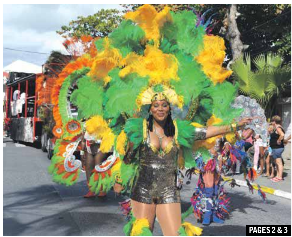
PAGES 2 & 3