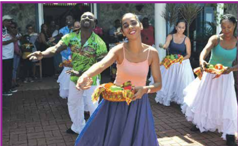
Vendredi, c'est l'Office de Tourisme qui était en fête et régalaît ses convives avec un buffet local. Les troupes de danseurs ont animé le site une bonne partie de l'après-midi.