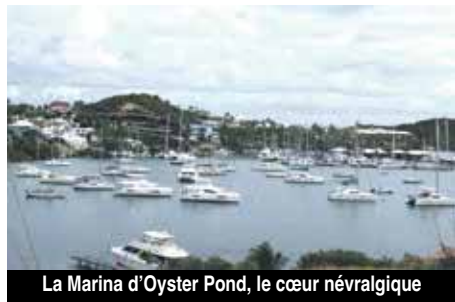
La Marina d'Oyster Pond, le cœur névralgique