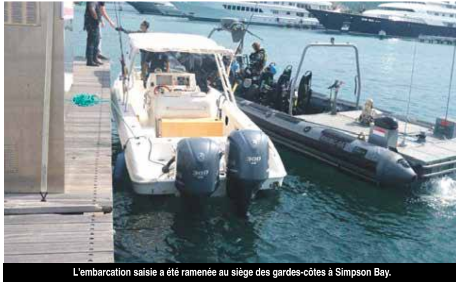
L'embarcation saisie a été ramenée au siège des gardes-côtes à Simpson Bay.

Le patrouilleur Holland s'est dirigé vers la position indiquée, qui semblait être aux environs de Saint-Eustache, par l'avion patrouilleur des gardes-côtes, qui avait repéré deux navires suspects et qu'il maintenait sous surveillance. Deux embarcations d'interception rapide des forces spéciales ont été mises à l'eau et se sont lancées à la rencontre des deux embarcations suspectes.