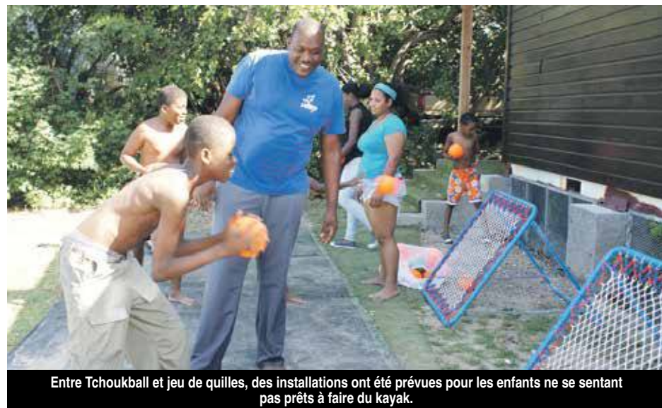
Entre Tchoukball et jeu de quilles, des installations ont été prévues pour les enfants ne se sentant pas prêts à faire du kayak.