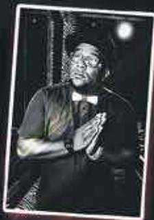
CLASSY D RNB/HIP-HOP/OLD SCHOOL