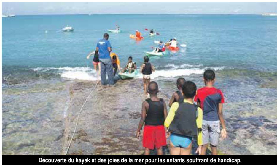
Découverte du kayak et des joies de la mer pour les enfants souffrant de handicap.

Une soixantaine d'enfants issus des classes ULIS (Unités Localisées pour l'Inclusion Scolaire) s'étaient donné rendez-vous mardi matin, à la salle omnisports de Galisbay. Au programme, entre autre, la découverte des activités nautiques : Kayak et voile.