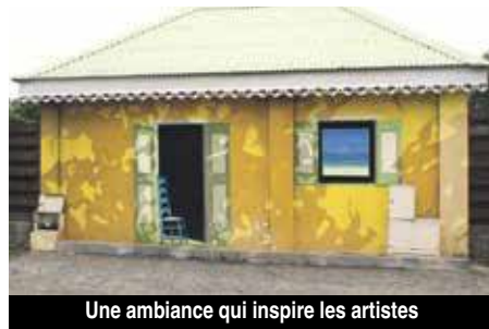
Une ambiance qui inspire les artistes

montagneux qui entoure le village, jouant son rôle de barrière naturelle, le promeneur plonge sur une vue paradisiaque. Et l'omniprésence de la Réserve naturelle en fait aussi un lieu protégé. Le village d'Oyster Pond, est bien un havre de paix dans un écrin de toute beauté, qui fait face à la mer.