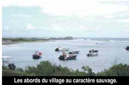
Les abords du village au caractère sauvage.

Situé à l'extrémité est de l'île, à cheval sur les parties française et hollandaise de l'île, le pittoresque village d'Oyster Pond bercé par les vents alizés, n'a pas son pareil ailleurs sur l'île.