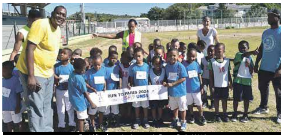
Et 70 kilomètres de plus pour le Run to Paris 2024 !

Nous remercions la collectivité de Saint-Martin et l'USEP Iles du Nord pour l'organisation.