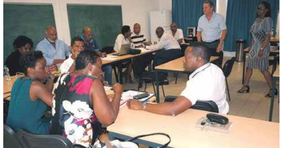
Cette première séquence de formation intéressait des cadres de la Collectivité qui travaillent dans le secteur de la sécurité, de la santé et de l'éducation.

Ce dernier assure qu'il y avait un véritable besoin d'accompagnement des agents de terrain, « que ce soit les fonctionnaires territoriaux, les fonc-