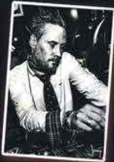
DORIAN ASHLEY CLUB/NU DISCO/HOUSE