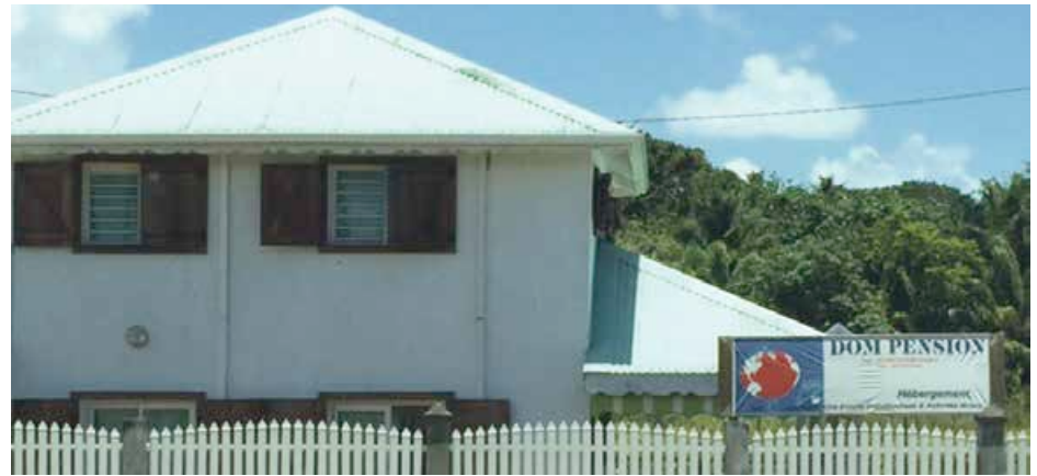
La maison de Dom Pension, située à Baie Mahault en Guadeloupe vous ouvre ses portes en cas de besoin.

C'est suite à sa propre expérience vécue, quand son père, gravement malade, a dû être évacué de-