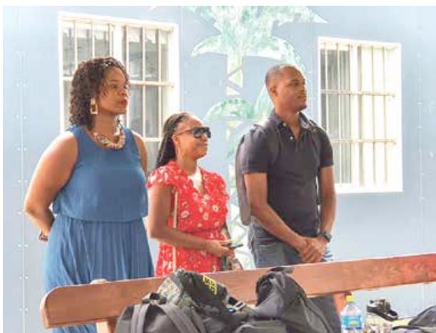
Les enseignants d'anglais, de français et de mathématiques dispenseront les cours indifféremment en français ou en anglais.

Suite à la pause méridienne, dès 14 heures, les élèves-athlètes ont suivi pendant deux heures leurs entraînements sportifs respectifs, sur le terrain de football, le terrain de basketball et la piste d'athlétisme de la Cité scolaire. Pendant cette période de « pré-rentrée », les élèves-athlètes vont être soumis à des différents tests, médicaux, d'effort, d'habileté mentale, sur les articulations, à un bilan podologique... A l'issue de cette première période, le 30 août, un bilan individuel sera réalisé en présence des parents.