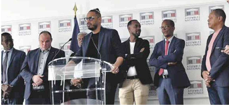
Plusieurs députés ultramarins ont tenu une conférence de presse pour indiquer leur mécontentement face à la nomination d'un nouveau ministre en remplacement de Jean-François Carenco.

Au lendemain de la passation de pouvoir entre Jean-François Carenco et Philippe Vigier à la fonction de ministre délégué des Outre-mer, des parlementaires ultramarins, pour l'essentiel appartenant à l'opposition présidentielle, ont convoqué une conférence de presse pour indiquer leur incompréhension.