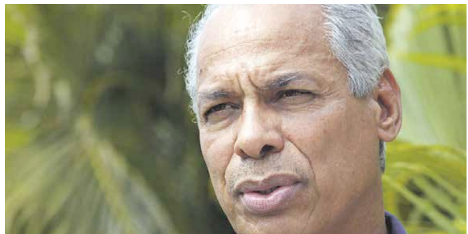
Le sénateur guadeloupéen Victorin Lurel demande l'intervention du gouvernement pour la mise en place d'une médiation.