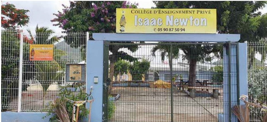
Des incertitudes planent aussi sur la reprise à la rentrée de septembre du collège privé Isaac Newton.

A quelques jours de la période des vacances scolaires estivales, sur proposition de la rectrice d'Académie de Guadeloupe, la préfecture de Saint-Barthélemy et Saint-Martin, a pris un arrêté le 30 juin 2023, actant la fermeture administrative définitive du collège privé hors contrat de l'Etat, René Descartes, situé à Hope Estate. Planent également de fortes incertitudes quant à la réouverture à la rentrée de septembre du collège privé hors contrat Isaac Newton, situé à Agrément, dont les raisons de fermeture pourraient être aussi financières.