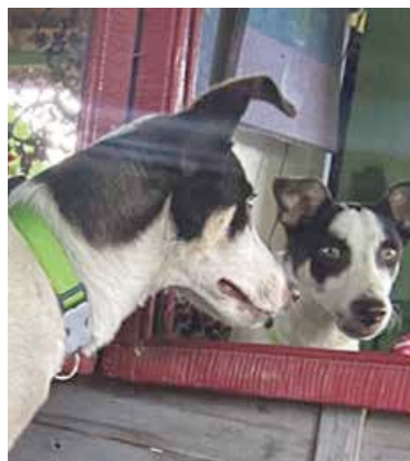
Ursula I love my island dog

J'ai été abandonné au Galion comme tant d'autres... mais j'ai eu beaucoup de chance qu'on m'ait aperçu dans les buissons, assis à côté de mon frère mort. Je remercie mes sauveurs et j'espère que ce qu'on m'a fait n'arrivera à aucun autre chien. Aujourd'hui je vais bien, le moral est bon et je joue avec plein d'autres toutous qui ont tous une histoire. Ce mois-ci l'association qui m'a accueilli fait un break et n'est donc pas en activité mais si vous désirez m'adopter, il y aura toujours quelqu'un. Ps j'aime les miroirs.