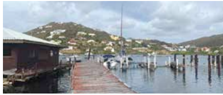
Détruite par le passage de l'ouragan Irma en septembre 2017, la marina d'Oyster Pond est depuis lors dans l'attente qu'un accord soit signé entre la France, les Pays-Bas, Saint-Martin et Sint Maarten, pour envisager un nouveau projet de développement.

Du côté de Sint Maarten, la première ministre Silveria Jacobs a convoqué une conférence de presse courant de la semaine dernière et a indiqué que le traité portant sur la frontière d'Oyster Pond sera signé le 26 mai, « par la Première ministre et ministre des Affaires générales Silveria Jacobs au nom du Royaume des Pays-Bas et le ministre de l'Intérieur et des Outre-mer Gérald Darmanin au nom de l'État français ». Elle a par ailleurs assuré que les changements n'affecteront pas la superficie des deux parties de l'île. Si quelque 348 points de la frontière de part en part entre Cupecoy et Oyster Pond seront modifiés, sans toutefois impacter les titres fonciers de particuliers (les zones concernées relevant pour la plupart du domaine public), la modification la plus marquante sera opérée sur les zones terrestre et maritime d'Oyster Pond. En effet, jusqu'alors, la partie terrestre revenait à la partie française, alors que la partie maritime était sous l'escarcelle de la partie hollandaise. En clair, la partie exploitation hôtelière du complexe "Captain Oliver" relevait du droit français, alors que l'exploitation de la marina de ce même complexe relevait du droit des Pays-Bas. Les taxes afférentes à ces exploitations étaient payées respectivement à Saint-Martin et Sint Maarten. Or, si l'on