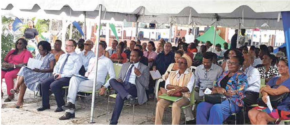
Un parterre d'officiels et de partenaires étaient réunis pour célébrer ce premier anniversaire de la Mission Locale de Saint-Martin.