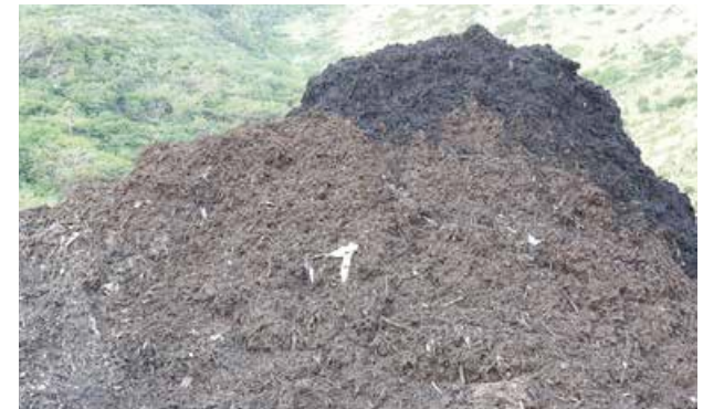
Le compost issu des déchets verts est impur car jonché de particules de plastique ou autres matériaux...