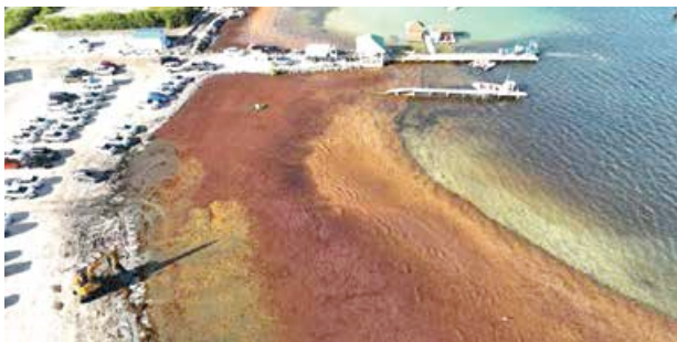
Image capturée le 3 février dernier par un drone (Souali drone) de la Baie de Cul de Sac

Les algues brunes sont de retour en masse sur nos côtes, témoignant de l'évolution du phénomène d'année en année. En effet, la saison d'échouements des sargasses semble s'allonger dans le temps, et d'importants premiers radeaux ont déjà envahi les côtes Est du littoral la semaine dernière, impliquant des premiers ramassages. Réunis au sein d'un comité de pilotage, les services de la Collectivité et ceux de l'Etat sont à pied d'œuvre pour affronter, ensemble, le fléau.