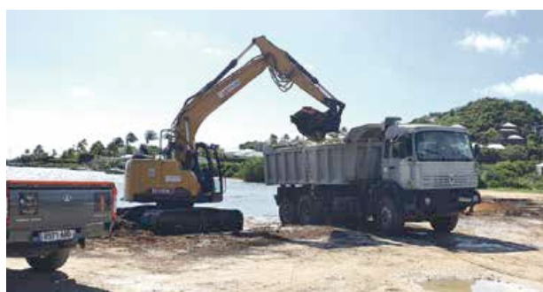
Le ramassage a pu être opéré rapidement, grâce à des bons de commande plafonnés pas encore atteints.

Les services ont également annoncé la pose de 5 postes fixes de détection des taux de gaz libérés par les sargasses à proximité des zones résidentielles, ainsi que 2 sections de barrages flottant pour protéger la population vivant à proximité, l'activité économique et les sites à forts enjeux touristiques et environnementaux. Ces barrages sont pour l'heure expérimentaux, la Collectivité ayant souscrit en parallèle à une étude plus vaste dont l'objectif est d'envisager la pose de barrages plus conséquents à moyen terme. V.D.