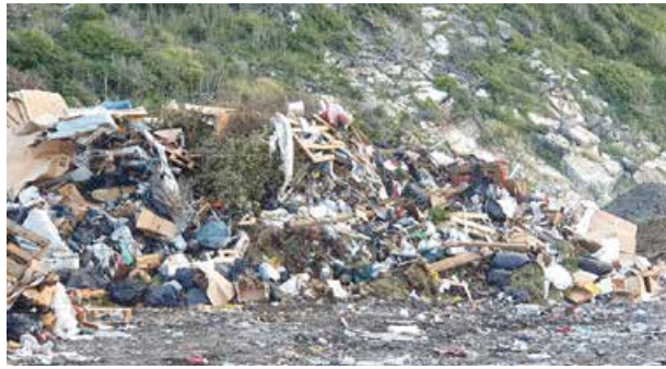
Absence de tri sélectif encore...

Un premier progrès, sauf que la notion de déchets non dangereux évacue tout déchet qui par définition est dangereux pour l'environnement. Une ISDND ne peut recevoir et enfouir que les déchets ultimes, qui n'ont pas de solution de recyclage ou de valorisation, en l'état actuel des technologies. Mais sans les gestes de tri en amont, les déchets qui sont enfouis comportent de nombreux matériaux qui pourraient être valorisés par le recyclage.