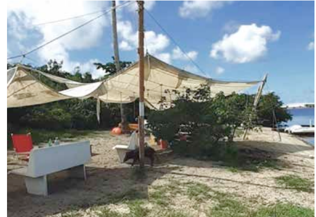
Le Grand Ilet est envahi par des campements sauvages, déchets de bateaux ou autres et colonies de cochons !

La périphérie de l'îlet a d'ores et déjà été nettoyée lors de la campagne d'enlèvement de VHU dans le lagon. La première mission de l'association sera donc de nettoyer le site, mais le Président