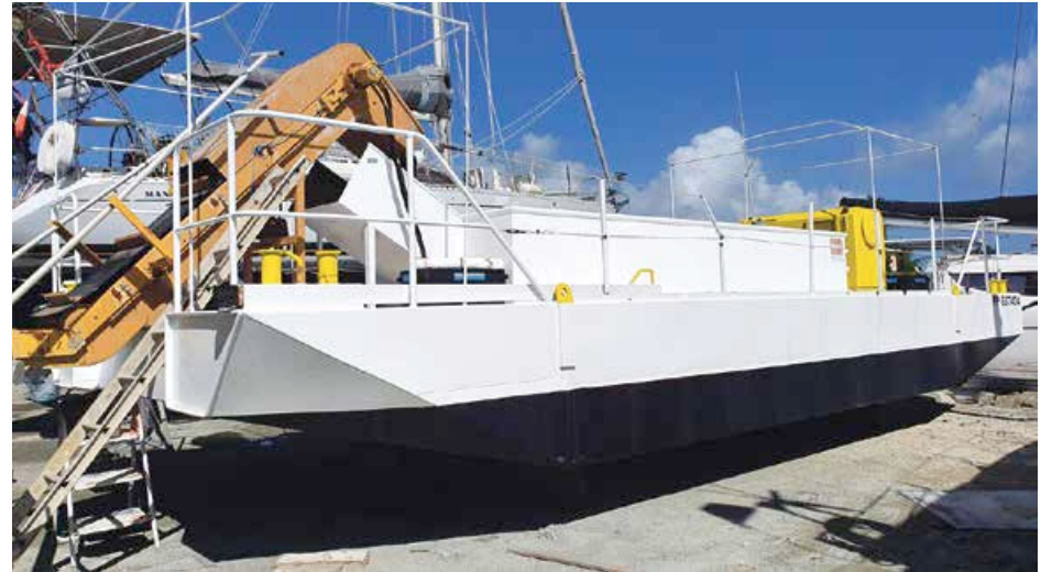
Spécialement conçue pour ramasser les algues brunes en mer, la barge "Force Pol Claude 1" est récemment arrivée à Saint-Martin et sera mise à l'eau dans les prochains jours.

A noter que la société Sea Protect Caraïbes possède également l'ensemble des matériels permettant le ramassage des algues qui arriveraient sur les rivages, en l'occurrence un tracteur équipé d'un grappin adapté permettant le ramassage sans sable ni petite faune, ainsi que les engins pour acheminer les sargasses vers l'écosite de Grandes-Cayes, à Cul de Sac ou bien vers d'au-