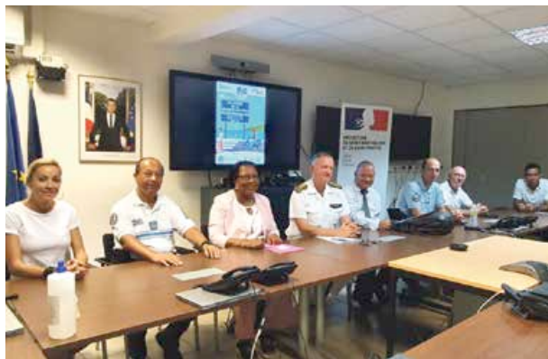
Lors d'une conférence de presse tenue vendredi dernier en préfecture, l'ensemble des acteurs participant à l'organisation de ces assises de la Sécurité routière étaient réunis autour du préfet: association Trait d'Union, Police territoriale, la 2e Vice-présidente de la Collectivité, le vice-recteur, le lieutenant colonel de la gendarmerie et l'association Sécurité Routière SXM.