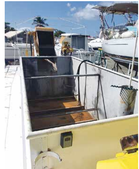
Un tapis roulant permet de collecter les sargasses en mer et les déverser dans une cuve pouvant contenir entre 8 et 10 tonnes d'algues.

tres sites de valorisation du déchet. Un projet issu d'une initiative privée qui permettrait d'aborder plus sereinement la prochaine saison d'échouements des sargasses. Pour rappel, la Collectivité et l'Etat, à l'occasion de la 1ère réunion du comité de pilotage installé en septembre dernier à cet effet, ont annoncé à titre expérimental et pour une première réponse immédiate au fléau, la pose de filets de barrage en amont des baies de Cul de Sac et de l'Embouchure. Ces filets installés, ont pour objectif de sanctuariser la baie de Cul de Sac, notamment au niveau de l'embarcadère afin de protéger l'activité de Pinel et des passeurs et de protéger la mangrove de l'Etang aux Poissons au niveau de la Baie de l'Embouchure. Les filets de barrages redirigeront les algues brunes vers des points de collecte à terre, qui impactent le moins possible les résidents. Ce dispositif créé localement s'inscrit dans le Plan Sargasses 2, lancé par le gouvernement en mars dernier, doté de près de 36 millions d'euros sur une période de 4 ans (2022/2025), et qui traduit une augmentation de près de 30% des financements de l'Etat.