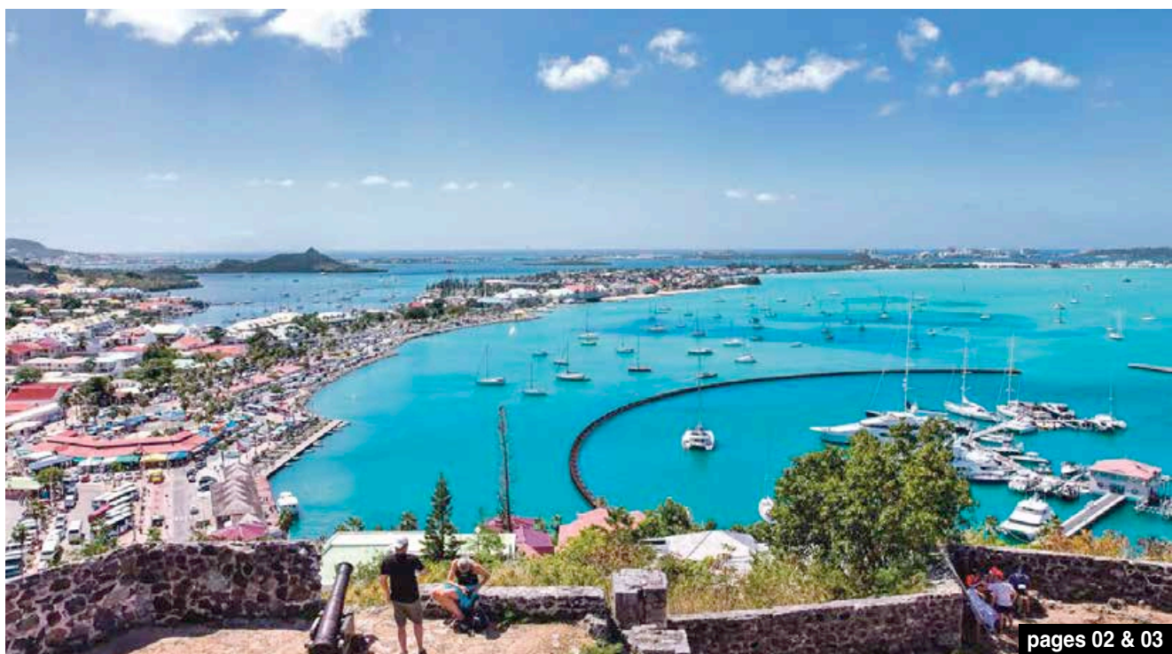
pages 02 & 03

Festival de la gastronomie : Demandez le programme !