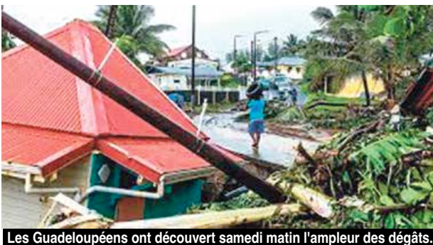
Les Guadeloupéens ont découvert samedi matin l'ampleur des dégâts.

En revanche, la tempête Fiona a causé d'importantes inondations en Guadeloupe, provoquant des éboulements de terrain et la destruction de nombreuses infrastructures routières. Un homme de 54 ans est décédé, probablement « emporté avec sa maison par les flots d'une rivière en crue », indiquait la préfecture de Guadeloupe. Le ministre de l'Intérieur Gérald Darmanin a annoncé dimanche que l'état de catastrophe naturelle serait reconnu en "fin de semaine prochaine". Un état de catastrophe naturelle qui permet d'enclencher les procédures auprès des assurances afin d'engager dans les meilleurs délais les travaux de déblaiement et de reconstruction mais aussi de déclarations de sinistres par les particuliers dont les biens