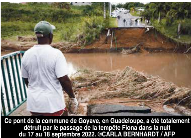
Ce pont de la commune de Goyave, en Guadeloupe, a été totalement détruit par le passage de la tempête Fiona dans la nuit du 17 au 18 septembre 2022.

En revanche, la tempête Fiona a causé d'importantes inondations en Guadeloupe, provoquant des éboulements de terrain et la destruction de nombreuses infrastructures routières. Un homme de 54 ans est décédé, probablement « emporté avec sa maison par les flots d'une rivière en crue », indiquait la préfecture de Guadeloupe. Le ministre de l'Intérieur Gérald Darmanin a annoncé dimanche que l'état de catastrophe naturelle serait reconnu en "fin de semaine prochaine". Un état de catastrophe naturelle qui permet d'enclencher les procédures auprès des assurances afin d'engager dans les meilleurs délais les travaux de déblaiement et de reconstruction mais aussi de déclarations de sinistres par les particuliers dont les biens