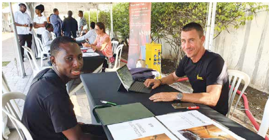
L'entreprise Garnier Electricité en cours d'entretien avec un jeune en recherche d'emploi.