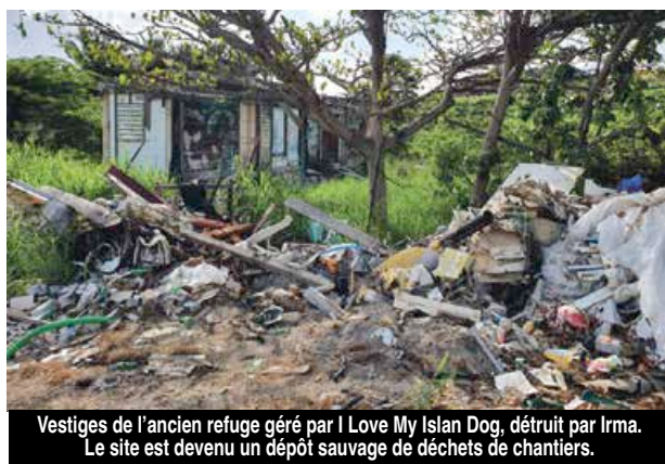
Vestiges de l'ancien refuge géré par I Love My Island Dog, détruit par Irma. Le site est devenu un dépôt sauvage de déchets de chantiers.