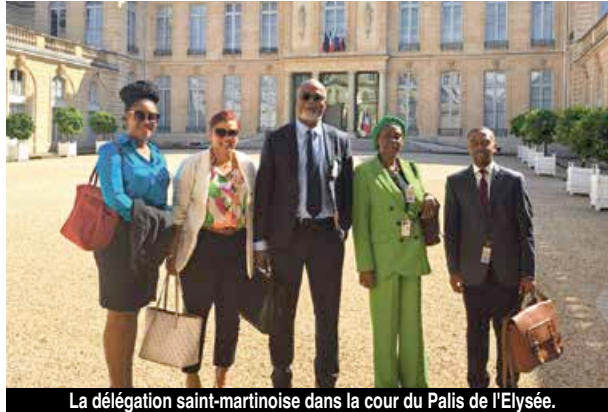
La délégation saint-martinoise dans la cour du Palais de l'Élysée.

Le Président et sa délégation se sont tout d'abord rendus au ministère des outre-mer 27 rue Oudinot, mardi 28 juin, où faute de