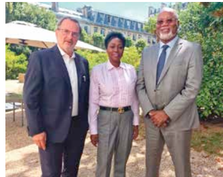
Rencontre avec le Ministre des Outre-mer, Jean-François Carencio.

Si la suppression du ministère des Outre-mer au profit d'un rattachement au ministère de l'intérieur donne un nouveau signal aux DOM-COM, la nomination de Jean-François Carencio en qualité de ministre délégué aux outre-mer, est ac-