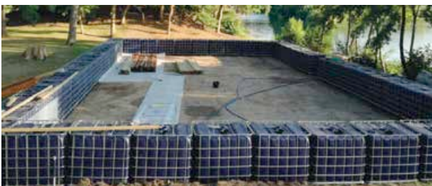
Exemple de construction d'un bassin hors d'eau similaire à celui qui sera implanté à Sandy Ground. Le bassin est ceinturé par des cuves remplies d'eau et pesant chacune une tonne. Un deck vient ensuite les recouvrir.