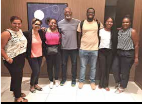
Rencontre du président avec les jeunes étudiants de l'association Pelicarus

le cadre d'une collaboration saine et pérenne avec l'Etat.