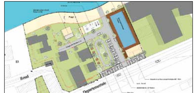
Implanté sur un terrain non constructible, situé à Sandy Ground, le projet de base nautique et de loisirs du Club Nautique de Saint-Martin comprend, outre la piscine à vagues, plusieurs autres complexes sportifs et de loisirs. Ce projet devrait être livré courant de l'année prochaine.