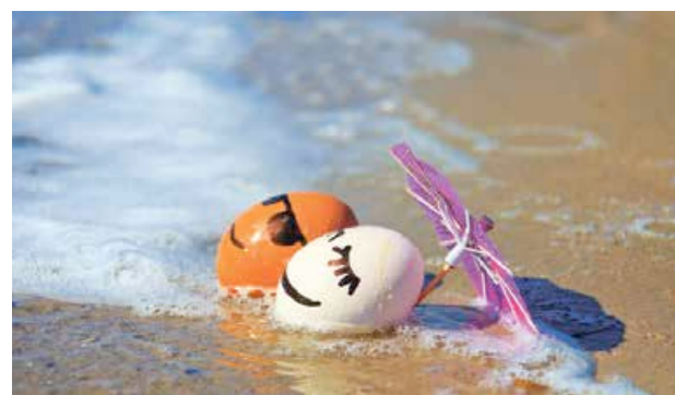
VENDREDI 15 AVRIL

A l'unisson, les deux parties de l'île fêteront Pâques durant ce long week-end avec, comme cela est la tradition, repas de familles, camping et vie chrétienne. Du vendredi Saint au lundi de Pâques, de nombreuses activités seront proposées, liées aux festivités pascales pour la plupart mais aussi à la vie locale. Petite sélection pour profiter de cette trêve.