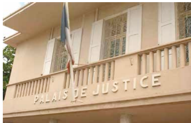
UN TRIBUNAL COMPRÉHENSIF ET CONFIAIT

En juin 2021, il avait fracturé la porte de service de l'Express, rue de la République, à coup de pied et s'était emparé du fonds de caisse. Les caméras de surveillance avaient enregistré l'action. Il sera rapidement confondu car le gérant du magasin le reconnaît facilement ; l'homme a l'habitude de traîner aux alentours et dérobe fréquemment des objets sur la terrasse de son commerce. Ce jour là, il n'y avait rien dans le fonds de caisse, mais la réparation de la porte coûtera 3000 € au commerçant. Pour expliquer son geste, l'homme indique lors de son audition par les gendarmes qu'il est démuné, qu'il n'a pas de revenus et qu'il ne peut travailler. Dix mois plus tard depuis sa prison, il précise que le premier confinement est tombé à une semaine d'un travail sur un grand chantier et que son lieu d'habitation a été incendié, qu'il a tout perdu, y compris ses papiers. Il indique qu'il touchait le fond : « je n'ai pas volé pour le plaisir et avec du recul aujourd'hui j'ai du mal à accepter ce que j'ai fait ».