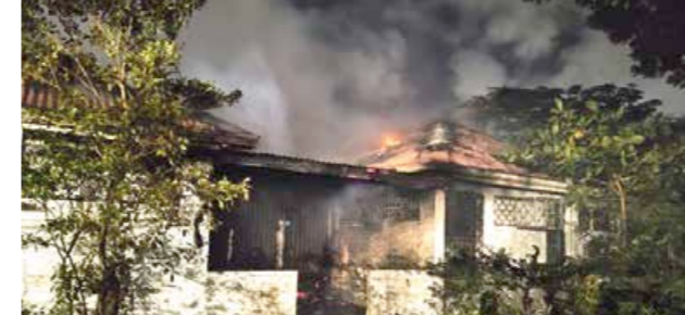
Feu d'habitation dans les locaux de Galisbay qui abritaient des services de l'Etat avant l'ouragan Irma.

Les sapeurs-pompiers ont été appelés courant du week-end dernier pour intervenir sur deux incendies. Deux sinistres en deux endroits différents, conséquence de faits de négligences et d'irresponsabilité, qui ont mobilisé pour chacun d'eux pendant plusieurs heures une dizaine de soldats du feu et deux camions équipés de lance à incendie.