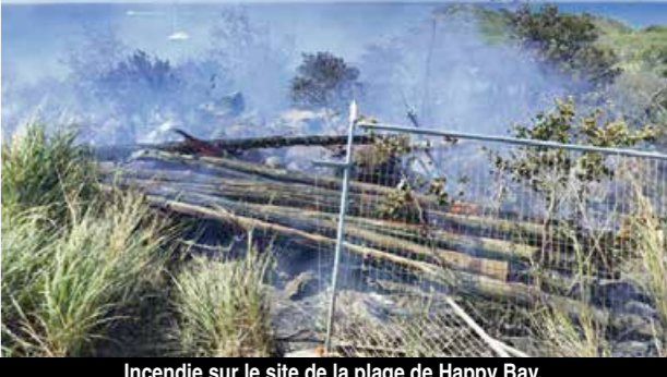
Incendie sur le site de la plage de Happy Bay. territoire, rappelons qu'il est irresponsable de procéder à des feux de déchets verts ou autres débris dans la nature. V.D.

Le second incendie, un feu de broussailles cette fois, s'est déclaré dans l'après-midi de dimanche, au niveau des collines qui surplombent la plage de Happy Bay, en lieu et place du SXM Festival qui doit se tenir à compter de demain, mercredi 9 mars. Les pompiers sont parvenus là encore à circonscrire les flammes, empêchant le risque de propagation et sans qu'il y ait eu de victimes à déplorer. Pour ce second incendie du week-end, ce sont 8 sapeurs-pompiers et 1 officier, équipés de deux engins avec lance à incendie qui ont été mobilisés pendant 4 heures. Au vu des fortes rafales de vent qui sévissent actuellement sur le