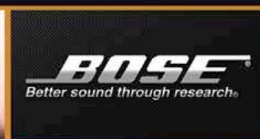
Système Audio Bose Premium *Fonction Disponible