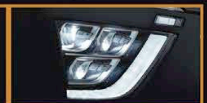
Phares LED Tri-Feux *Fonction Disponible

Frais d'immatriculation, TGCA, et Carte Grise incluses! 1ère révision gratis offert!