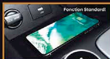
Bloc de Chargement sans Fil