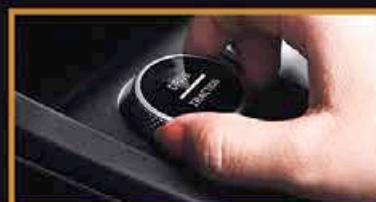
Contrôle de la Traction (Boue/Sable/Neige) *Fonction Disponible