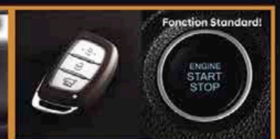
Clé Intelligente avec Démarrage par Pousse-Bouton