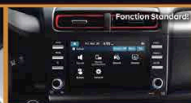
Écran Tactile 8 Pouces avec Android Auto/Apple Car Play