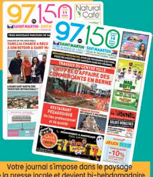
Votre journal s'impose dans le paysage de la presse locale et devient bi-hebdomadaire, les mardis et les vendredis.