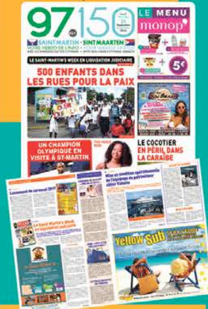
Nouvelle ligne rédactionnelle