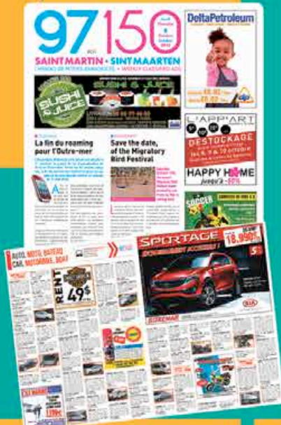
Journal de petites annonces