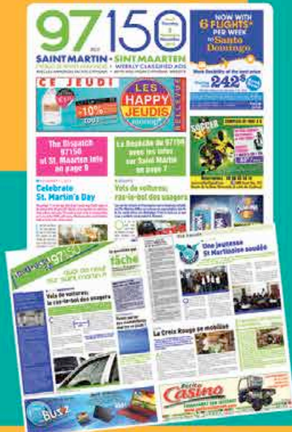
L'actualité locale s'invite dans les colonnes