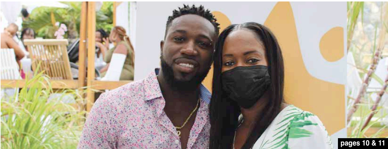
pages 10 & 11