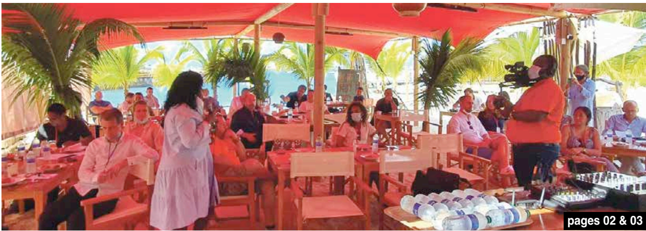
pages 02 & 03