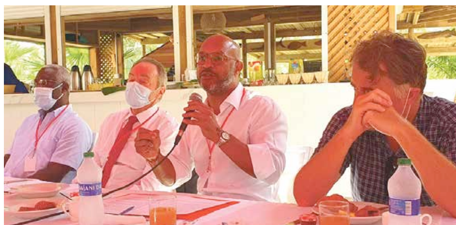
Attendu sur ces questions par les chefs d'entreprises, le président Gibbs a expliqué la réalité des choses, sans langue de bois.