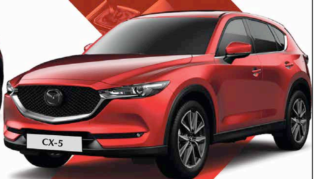
2022 | Mazda CX-5