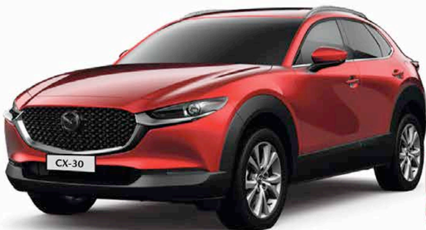
2021 | Mazda CX-30