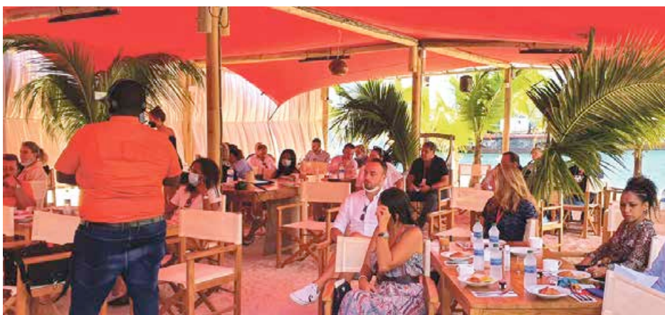
Une soixantaine de personnes représentant le secteur économique étaient conviées à cette matinée de travail organisée par la FIPCOM

A l'initiative de la FIPCOM, le monde de l'entreprise était invité samedi matin à se réunir autour d'un petit-déjeuner, dans les jardins de l'hôtel Hommage à la Baie Nettlé. Pendant près de trois heures, la soixantaine de convives a échangé sur l'importance des problèmes rencontrés par le secteur de l'économie et les possibles solutions qui pourraient être mises en place pour y remédier.