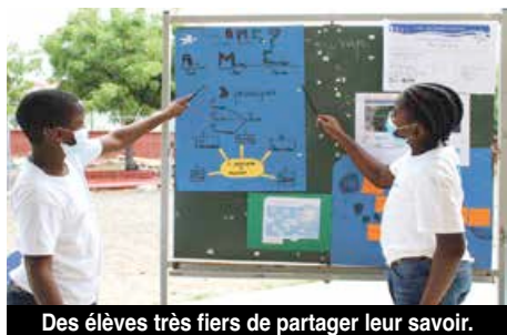
Des élèves très fiers de partager leur savoir.