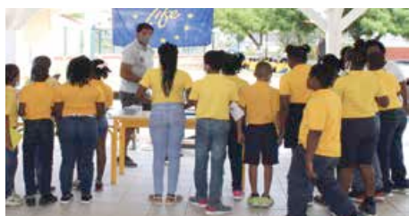
A la découverte de la faune marine avec la Réserve Naturelle.

Comment trier les déchets, le cycle de traitement des eaux usées, l'action des éco systèmes et plus particulièrement de la mangrove, comment fabriquer du papier recyclé ou encore l'observation des