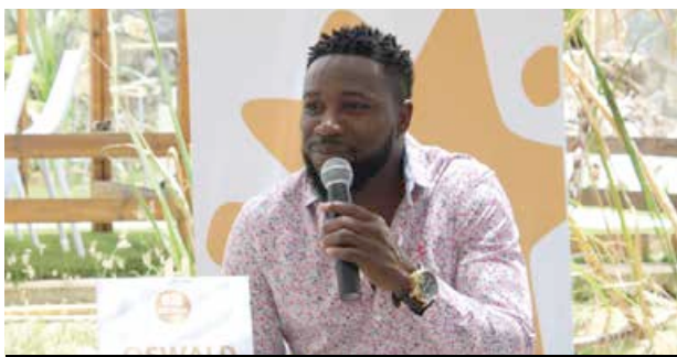
Oswald, artiste saint-martinois et ... international !

Il est l'artiste de la Caraïbe le plus en vogue du moment. Il vient de sortir son second album, « Option », est dans les starting-blocks pour une prochaine tournée internationale et vient de signer un partenariat avec les Offices de tourisme de part et d'autre de la frontière de l'île. Un joli coup de projecteur pour la destination que l'artiste nous offre en venant tourner deux clips dans les décors de son île natale.