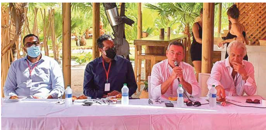
La FIPCOM et l'UDE-MEDEF Guadeloupe ont relevé l'ensemble des suggestions apportées au cours de cette matinée de travail pour les faire remonter dans les différentes instances compétentes.