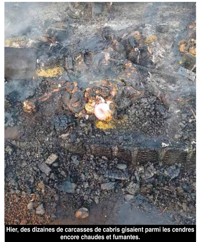
Hier, des dizaines de carcasses de cabris gisaient parmi les cendres encore chaudes et fumantes.