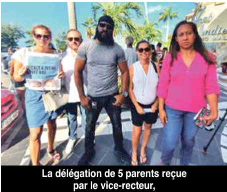
La délégation de 5 parents reçue par le vice-recteur,