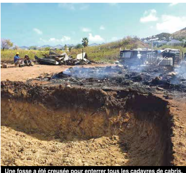
Une fosse a été creusée pour enterrer tous les cadavres de cabris.