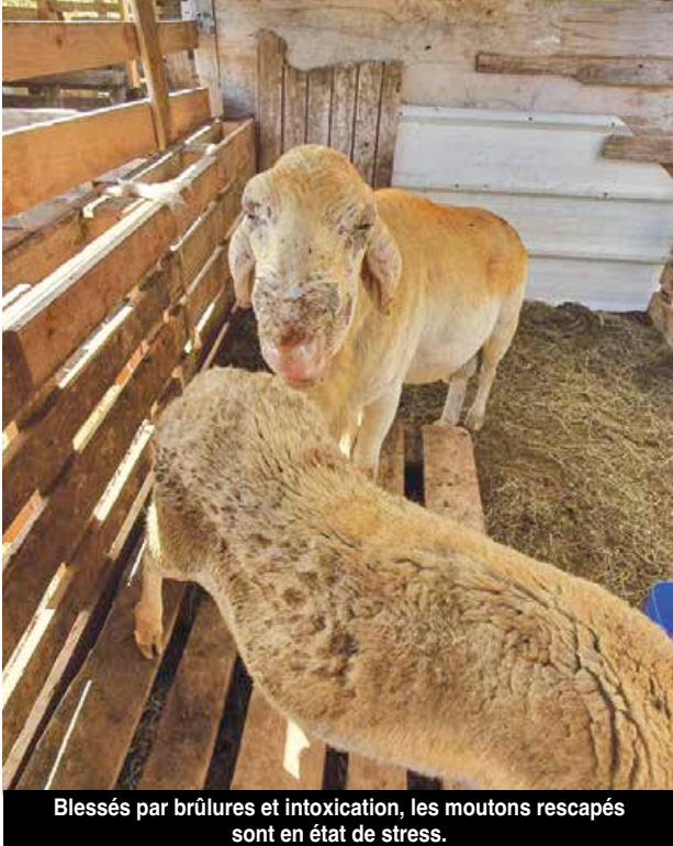
Blessés par brûlures et intoxication, les moutons rescapés sont en état de stress.

La piste criminelle est privilégiée par les enquêteurs pour cet incendie qui s'est déclaré dimanche matin, vers 6 heures, sur la route de la décharge de Cul de Sac. Un acte d'une cruauté innommable, puisque les bêtes, environ 70 cabris, selon le propriétaire, ont été prises au piège dans leur abri fermé et ont brûlé vives. Sur les réseaux sociaux, certains commentaires ont fait part des hurlements des animaux qui ont résonné dans tout le quartier.