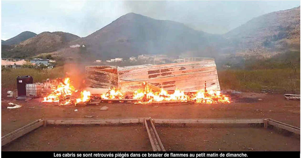
Les cabris se sont retrouvés piégés dans ce brasier de flammes au petit matin de dimanche.