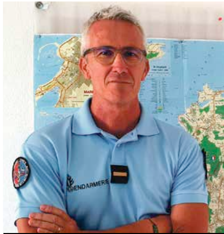
Le référént-suret a rejoint les rangs des militaires en septembre dernier.

Alors qu'une belle accalmie a été observée sur les 6 premiers mois de l'année, en partie due à la mise en place des dispositifs de contrôles aux frontières, la gendarmerie de Saint-Martin constate une forte recrudescence des faits de vols à main armée (VAMA) depuis la mi-octobre.