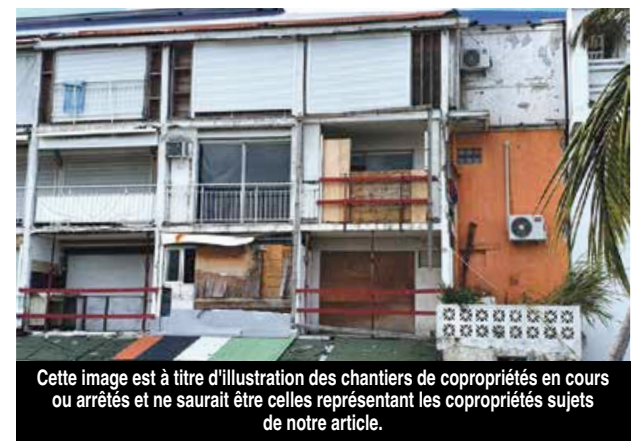
Cette image est à titre d'illustration des chantiers de copropriétés en cours ou arrêtés et ne saurait être celles représentant les copropriétés sujets de notre article.

L'escroquerie a été découverte et l'agent général Allianz a demandé à son courtier de déposer une plainte pour faux et usage de faux. Ce qui a été fait. Cette première plainte, déposée le 11 novembre 2019 à la gendarmerie du lieu de la résidence du courtier qui s'est fait usurper son identité, a été présentée au parquet de ce département en décembre 2019 qui s'en est lui-même dessaisi au profit du parquet du département d'immatriculation (en