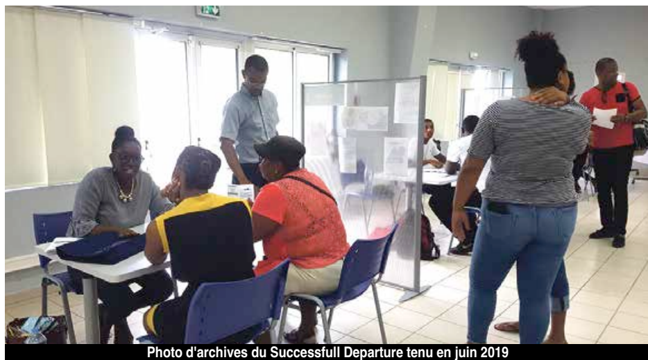
Photo d'archives du Successful Departure tenu en juin 2019

En conseil exécutif du mercredi 7 octobre dernier, les élus ont acté la création d'un salon de l'étudiant qui devrait se tenir en janvier pour chacune des quatre prochaines années.