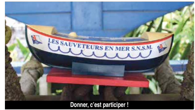
Donner, c'est participer !