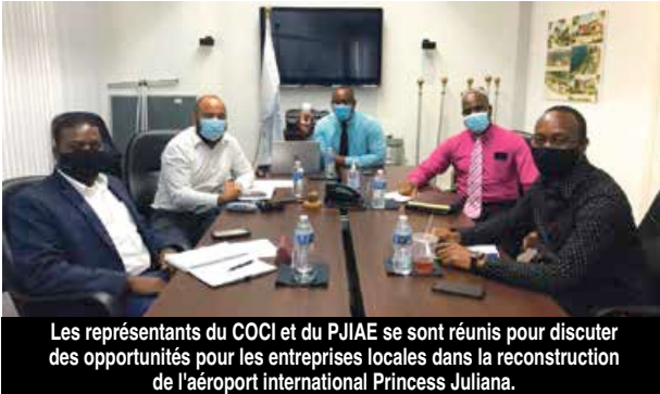
Les représentants du COCI et du PJIAE se sont réunis pour discuter des opportunités pour les entreprises locales dans la reconstruction de l'aéroport international Princess Juliana.

La chambre de commerce de Sint Maarten (COCI) et la direction de l'aéroport international Princess Juliana ont tenu une réunion en début de semaine pour évoquer l'implication des entreprises locales dans le processus de reconstruction de l'aéroport.