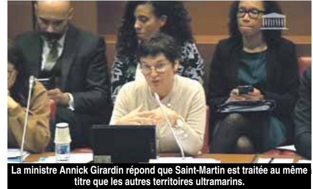
La ministre Annick Girardin répond que Saint-Martin est traitée au même titre que les autres territoires ultramarins.

d'eau potable, avec en plus, un gros souci de santé publique avec le bromate. Et on ne peut pas me dire qu'il n'y a pas eu de « remontées de projets » sur ces sujets... », a encore précisé la députée. Semblant agacée, la Ministre Girardin a répondu que toutes deux n'avaient pas le même humour : « Zéro pour les territoires, cela n'existe pas pour moi ! Et en l'occurrence,