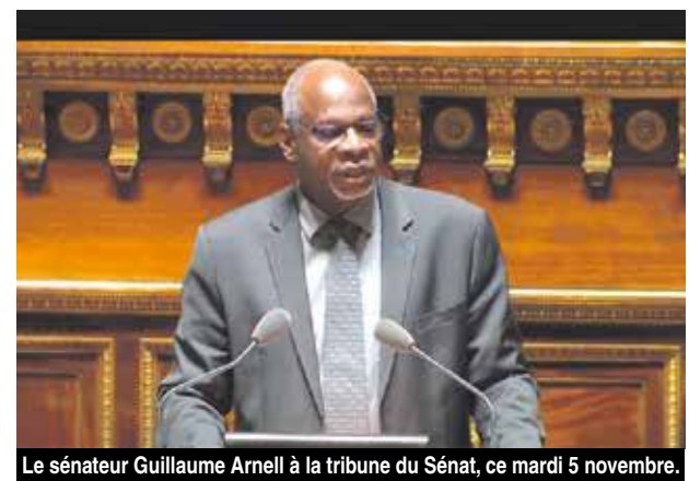
Le sénateur Guillaume Arnell à la tribune du Sénat, ce mardi 5 novembre.

constatation des infractions et d'interruptions des travaux n'étaient prévues. Des failles notamment révélées suite au passage de l'ouragan Irma, le 6 septembre 2017, dont les dégâts ont dévoilé au grand jour la vulnérabilité des habitations situées dans les zones côtières, l'habitat précaire et les constructions illégales dans certains quartiers avec notamment des habitations construites sans permis dans des zones submersibles. Une commission parlementaire a donc été mandatée pour la réalisation d'un rapport et une proposition de ratification de l'ordonnance, proposée par la Ministre des Outre-mer, Annick Girardin, en mars dernier. L'objectif étant d'introduire dans le code d'urbanisme de la Collectivité les sanctions pénales et les procédures pénales applicables en cas d'infractions des règles. Un exercice peu difficile, puisque le code local se rapprochant du code national, avec des aménagements adaptés au territoire, la Commission a proposé qu'y soit introduit les mêmes règles pénales que celles figurant dans les codes nationaux de l'urbanisme.