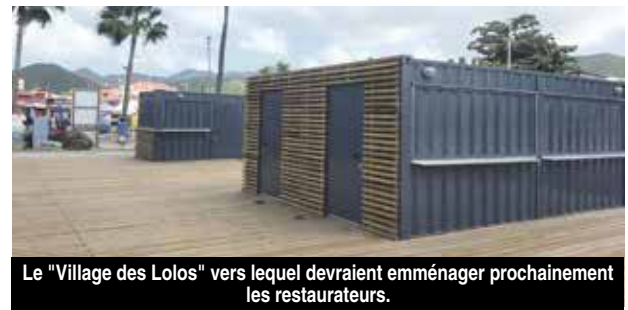
Le "Village des Lolos" vers lequel devraient emménager prochainement les restaurateurs.

assurait rester à l'écoute des desiderata des exploitants des lolos et est propice à porter prochainement des améliorations au Village des Lolos, notamment par la mise en place d'apprentis reliant chacun des containers et l'installation de plantes et autres espaces paysagers. Cependant, la fermeté du côté de la COM reste de rigueur, face aux problèmes d'insécurité et de non-respect des normes que présente le bâtiment historique des lolos du Front de mer. Les services confirmaient une prochaine réunion avec les lolos pour trouver une issue favorable aux problèmes posés.