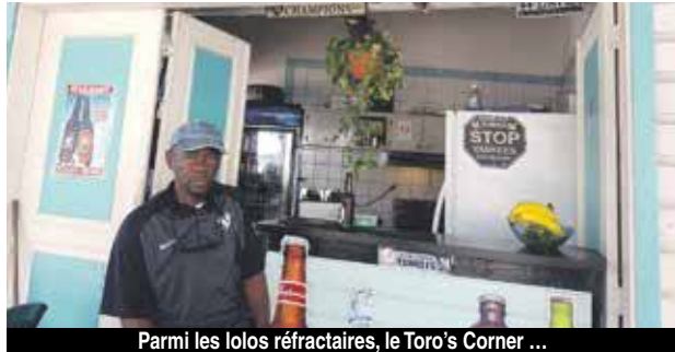
Parmi les lolos réfractaires, le Toro's Corner ...

Initialement prévus pour être occupés par les restaurateurs exploitant les lolos, dès ce mois de novembre, les containers récemment installés sur le front de mer sont loin de faire l'unanimité du côté des restaurateurs. En effet, certains d'entre eux se déclarent insatisfaits du « rendu » final de ces installations et ne souhaitent pas y emménager sans que certaines améliorations y soient apportées.