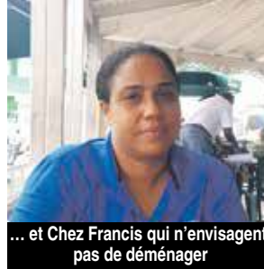
... et Chez Francis qui n'envisagent pas de déménager

Interrogés pour savoir s'ils avaient été concertés par la Collectivité en amont de l'élaboration du projet, les restaurateurs