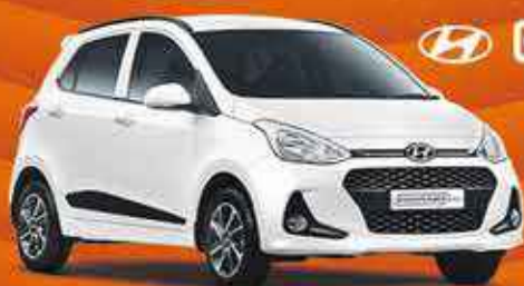
HYUNDAI GRAND i10