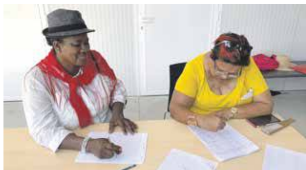
Près de 140 manifestants ont apposé leur signature sur le registre des doléances de l'enquête publique pour dire "Non au PPRn".

nue que les manifestants ont une fois encore considérée comme étant une marque de mépris de la part de la préfète, et alors que cela n'avait pas été préalablement prévu ni communiqué aux autorités, le cortège s'est dirigé vers le rond-point d'Agrément, bloquant la circulation routière en ce point névralgique de l'île.