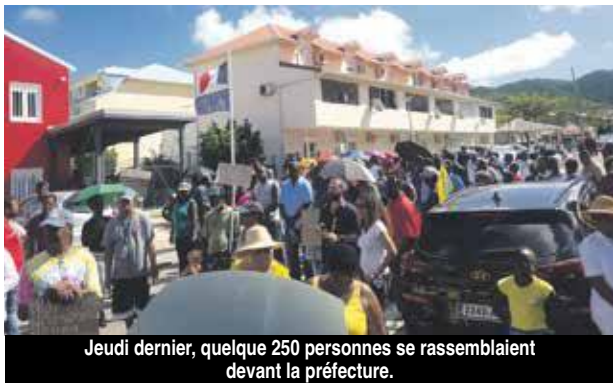
Jeudi dernier, quelque 250 personnes se rassemblaient devant la préfecture.

Jeudi 31 octobre dernier, date de clôture de l'enquête publique relative au PPRn, le collectif Soualiga United et le mouvement Grass Roots conviaient la population à venir marquer leur protestation eu égard à la forme et au fond de cette réglementation que veut imposer l'Etat à Saint-Martin. Invité également dans les protestations des manifestants, le problème de l'eau polluée aux bromates.