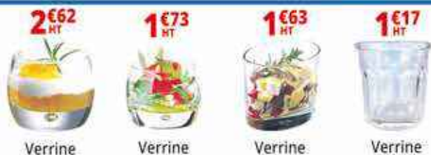
Verrine 2€62 HT, Verrine 1€73 HT, Verrine 1€63 HT, Verrine 1€17 HT

Hope Estate (à côté de Tout à Louer) 06 90 718 718 - 05 90 87 13 41 pbk97150@gmail.com Ouvert de 7h à 17h