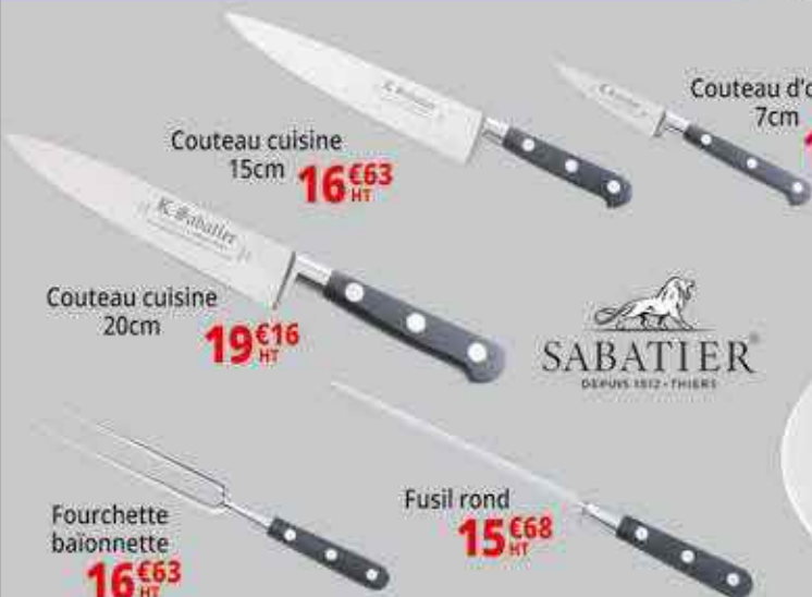
Couteau cuisine 15cm 16€63 HT Couteau cuisine 20cm 19€16 HT Couteau d'office 7cm 10€46 HT Sabatier Fourchette baïonnette 16€63 HT Fusil rond 15€68 HT