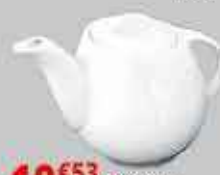
10€53 HT Théière