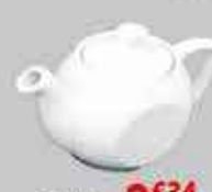
9€34 HT Théière