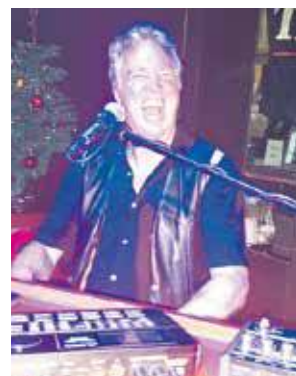
31 décembre avec live music et Dj Party.

est un habitué des grands clubs dans tous les Etats-Unis et ses passages vous promettent toujours de nouvelles belles nuits entraînant ! Nous notons également tous les samedis la 'Ladies Night', tous les lundis le concert du groupe Church on Monday dans son répertoire 'What's the Funk' et n'oubliez pas de réserver pour la 'Count-down to the New Year' le lundi