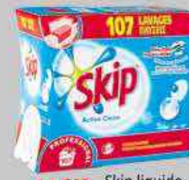
41€48 HT Skip liquide