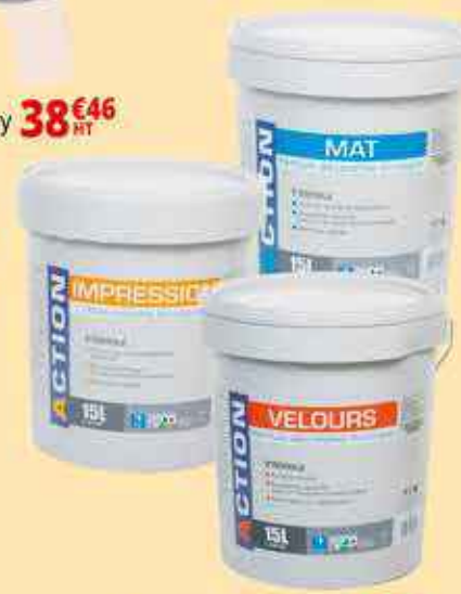
Peinture Action 15L 49€ HT