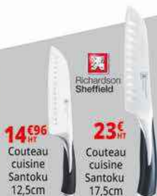
Richardson Sheffield 14€96 HT Couteau cuisine Santoku 12,5cm 23€ HT Couteau cuisine Santoku 17,5cm