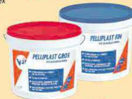
Pelliplast gros ou fin 23€94 HT