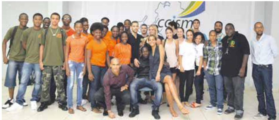
Les anciens élèves de Saint-Martin vous attendent nombreux ! (Photos d'archive 2016)

C'est demain après-midi, samedi 22 décembre, que les anciens lycéens de Saint-Martin partis aux quatre coins du monde faire leurs études supérieures, donnent rendez-vous aux lycéens pour partager avec eux leurs expériences et leur donner de multiples précieux conseils pour préparer sereinement leur avenir.