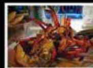
Lobster Party & Live Music le Vendredi