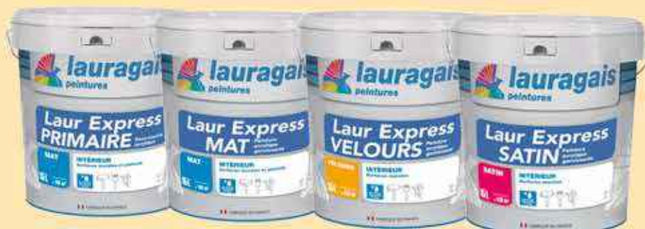
Laur Express 15L 99€ HT