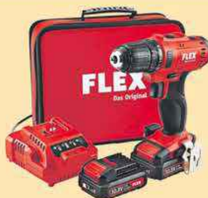
Visseuse/perceuse DD 2G 10,8-lid black Flex 185€90 HT