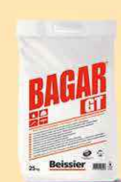
Bagar GT 25kg 16€04 HT