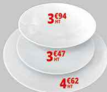
3€94 HT 3€47 HT 4€62 HT Assiettes porcelaine

Venez découvrir notre gamme de PRODUITS DE NETTOYAGE à base de plantes 100% biodégradables