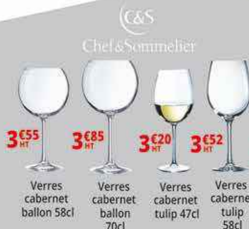
C&S Chef & Sommelier 3€55 HT Verres cabernet ballon 58cl 3€85 HT Verres cabernet ballon 70cl 3€20 HT Verres cabernet tulip 47cl 3€52 HT Verres cabernet tulip 58cl