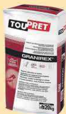
Granirex Toupret 20kg 42€95 HT