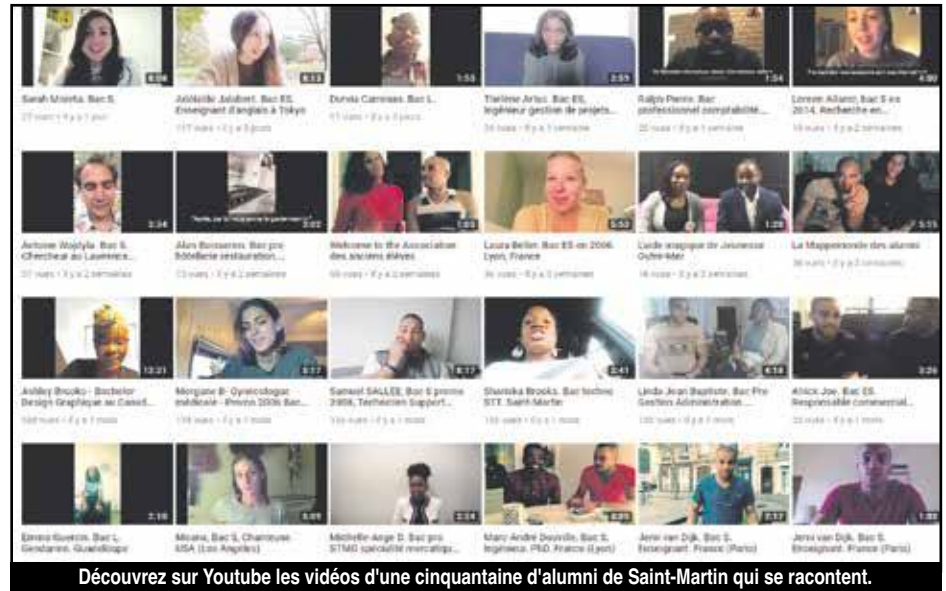
Découvrez sur Youtube les vidéos d'une cinquantaine d'alumni de Saint-Martin qui se racontent.

rents, enseignants, rendez-vous tous demain, samedi 22 décembre, à la CCISM de Concordia, à partir de 14 heures. V.D.