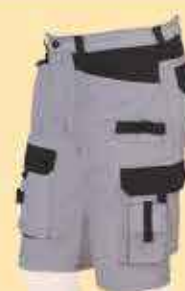
Short Dulary 38€46 HT