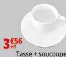
3€56 HT Tasse + soucoupe