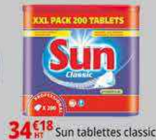
34€18 HT Sun tablettes classic