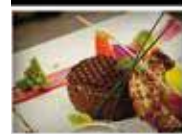
Surf & Turf Party & Live Music le Lundi