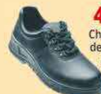
43€27 HT Chaussures de sécurité Dulary