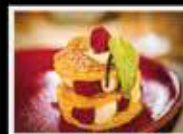
Live Music le Samedi

L' Astrolabe: Le rendez-vous des fins gourmets.