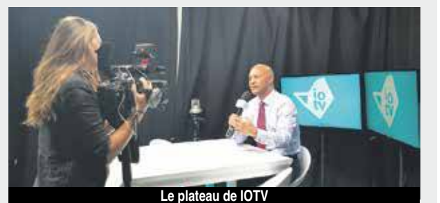
Le plateau de IOTV

Grâce à ces nouveaux locaux, IoTv qui rayonne déjà au-delà de notre horizon va pouvoir développer de nouveaux formats d'émissions, avec des plateaux d'invités et encore d'autres surprises que nous ne tarderons pas à révéler. V.D.