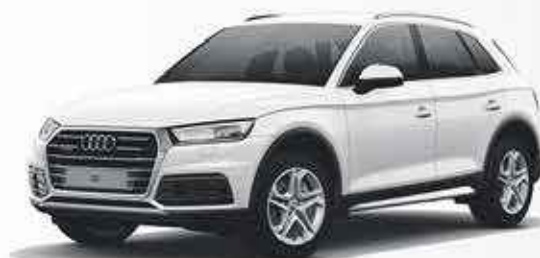
AUDI Q5 3000€ de remise

3 ANS DE RÉVISIONS GRATUITES (8 RÉVISIONS) SUR TOUS LES MODÈLES FORD 2018.