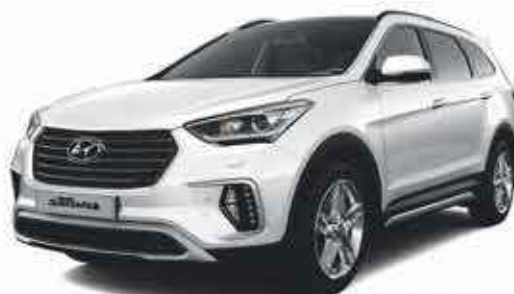
HYUNDAI GRAND SANTA FE 4500€ de remise