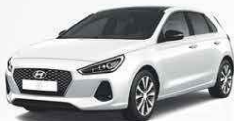
HYUNDAI I30 2500€ de remise