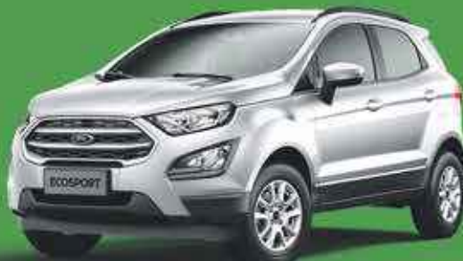
FORD ECOSPORT 2000€ de remise