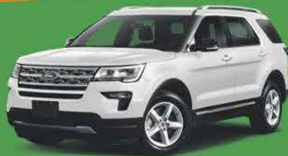
FORD EXPLORER 3000€ de remise