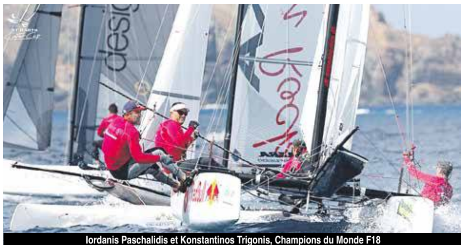
Iordanis Paschalidis et Konstantinos Trigonis, Champions du Monde F18

Une soixantaine d'équipages sont attendus pour la 11e édition de la Saint-Barth Cata Cup qui va se dérouler du 14 au 18 novembre 2018. De grosses pointures sont attendues cette année avec la participation, entre autres, du binôme Grec Iordanis Paschalidis et Konstantinos Trigonis, récemment sacrés champions du Monde de Formule 18 (F18) aux Etats-Unis.