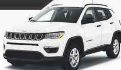
JEEP COMPASS 2000€ de remise