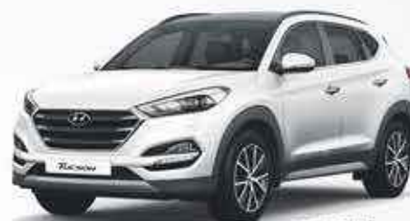
HYUNDAI TUCSON 3000€ de remise