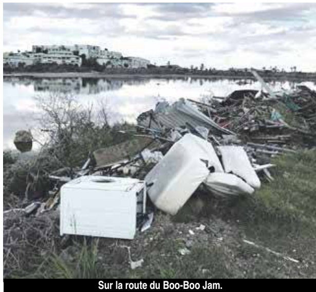
Sur la route du Boo-Boo Jam.

Six bateaux sont annoncés le 14 novembre et six autres le 28 novembre, soit à chaque fois près de 20 000 touristes qui vont débarquer pour découvrir l'île et ce n'est qu'un début (source The Daily Herald) car l'activité des bateaux de croisières est annoncée plutôt dense cette saison. C'est une bien piètre image que le côté français va leur offrir, celle de sites touristiques dégradés et envahis par les déchets en tout genre. Alors ne nous plaignons pas si les prochains visiteurs préféreront rester côté hollandais et laisser la partie française stagner dans son marasme économique ... les commentaires sur les réseaux sociaux, entre autres, feront leur œuvre.