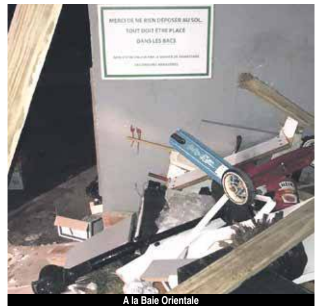
A la Baie Orientale

Si tant est qu'il faille le rappeler, la déchèterie à Galisbay reçoit gratuitement tous les encombrants et autres gros déchets en provenance des particuliers. L'Ecosite de Grandes Cayes est destiné à recevoir tous les déchets triés en provenance des professionnels.