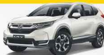
HONDA CR-V 2000€ de remise