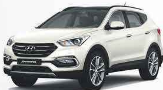
HYUNDAI SANTA FE 4500€ de remise