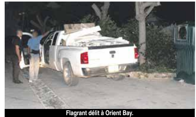
Flagrant délit à Orient Bay.