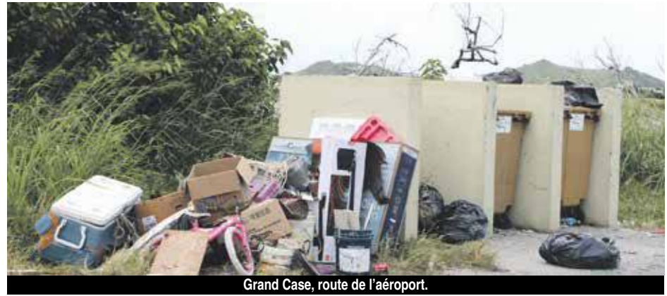
Grand Case, route de l'aéroport.

Oui, encore une fois, on parle du même sujet. C'est certainement utopique, mais peut-être qu'en revenant sur les points qui fâchent la conscience collective va se réveiller et la mauvaise foi s'estomper ? Mais difficile de s'accrocher à cet espoir quand on constate chaque jour que les particuliers n'ont toujours pas compris que les locaux poubelles sont destinés à mettre les déchets ménagers dans ... les poubelles et non pas à côté ! Oui, c'est utopique d'imaginer que les gros encombrants seront amenés directement à la décharge et non pas jetés dans le premier terrain