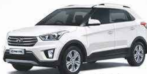
HYUNDAI CRETA 3000€ de remise