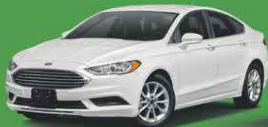
FORD FUSION 3500€ de remise

3 ANS DE RÉVISIONS GRATUITES (8 RÉVISIONS) SUR TOUS LES MODÈLES FORD 2018.