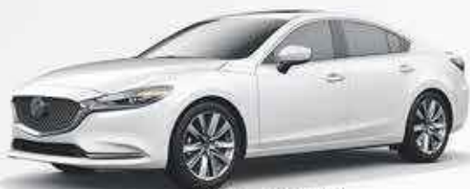
MAZDA 6 3500€ de remise

LES PREMIERS ARRIVÉS SERONT LES PREMIERS SERVIS.