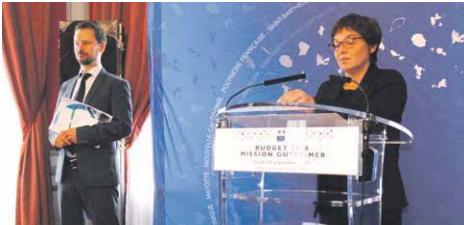
La Ministre des Outre-mer, Annick Girardin.

L'adoption des crédits de la mission outre-mer mardi soir par la commission des Lois de l'Assemblée nationale a été l'occasion pour Annick Girardin, ministre des outre-mer de rappeler les orientations fortes de ce projet de budget pour 2019.