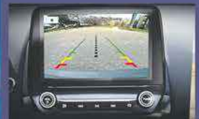
CAMÉRA DE RECUIL. APPLE CARPLAY/ANDROID AUTO.