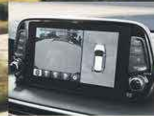
Caméra à angle 360°