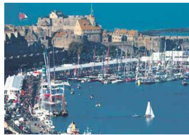
Six classes de bateaux (Ultime, Multi 50, Imoca, Class40, Rhum Mono, Rhum Multi) pour six places de vainqueur ! V.D.

ront huit skippers guadeloupéens qui seront sur la ligne de départ, Un nombre record ! Cinq d'entre eux sont soutenus par la Région Guadeloupe. Plus de 3500 milles à parcourir pour rejoindre Pointe-à-Pitre le plus rapidement possible et ainsi graver son nom dans la légende.