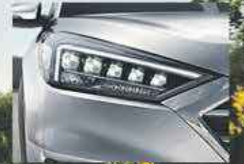
Phares à décharge haute intensité