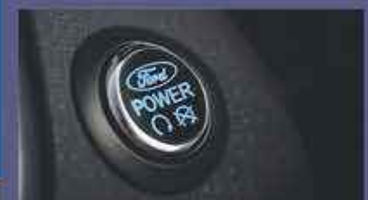
BOUTON DE DÉMARRAGE.

A partir de 17,990€! TTC* Après un apport de 15% (2698€) 59 mensualités de 337€