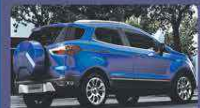
NOUVELLE MOTORISATION PUISSANTE.