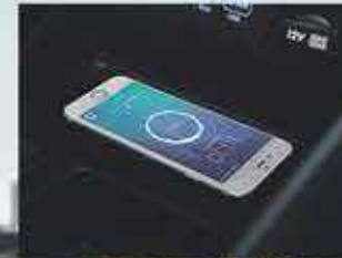
Recharge sans fil