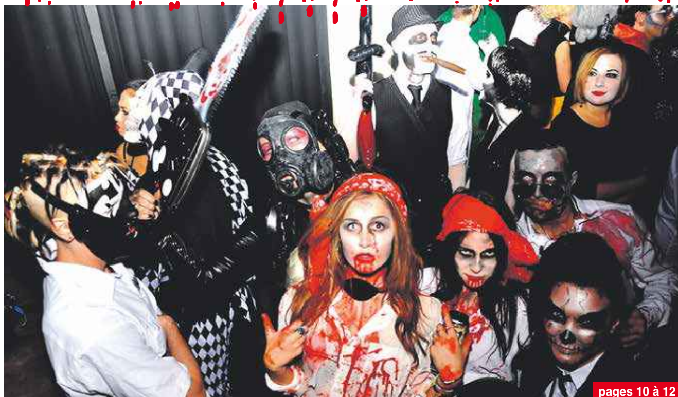
pages 10 à 12

Deux braquages commis la semaine dernière page 06