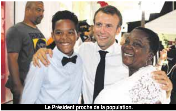
Le Président proche de la population.