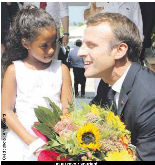
un au revoir souriant ...