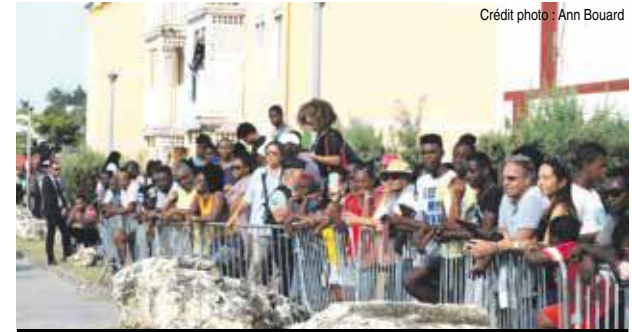
Les habitants de Quartier d'Orléans dans l'attente de serrer la main du Chef de l'Etat.