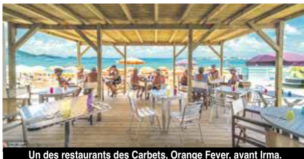
Un des restaurants des Carbets, Orange Fever, avant Irma.

celle entre les Carbets et le Kontiki sera modifiée, et fera gagner entre 500 à 1000 m2 aux carbets. Des mètres carrés consacrés à l'installation de deux boutiques mais surtout à un espace blanc ... autrement dit à une plage publique, libre d'accès pour tous. - Le portail actuel, situé à la limite du Kontiki et de la parcelle des carbets va être supprimé. Positionné sur un accès public, il avait été toléré mais selon Steven Patrick est illégal. A charge de la copropriété de la BO de trouver d'autres moyens de sécuriser son accès. - Les commerces auront la possibilité de rester ouvert le soir.