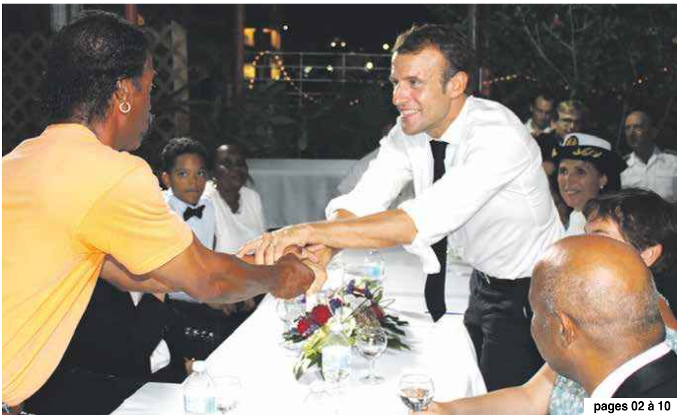
pages 02 à 10

Questions-réponses avec les acteurs économiques