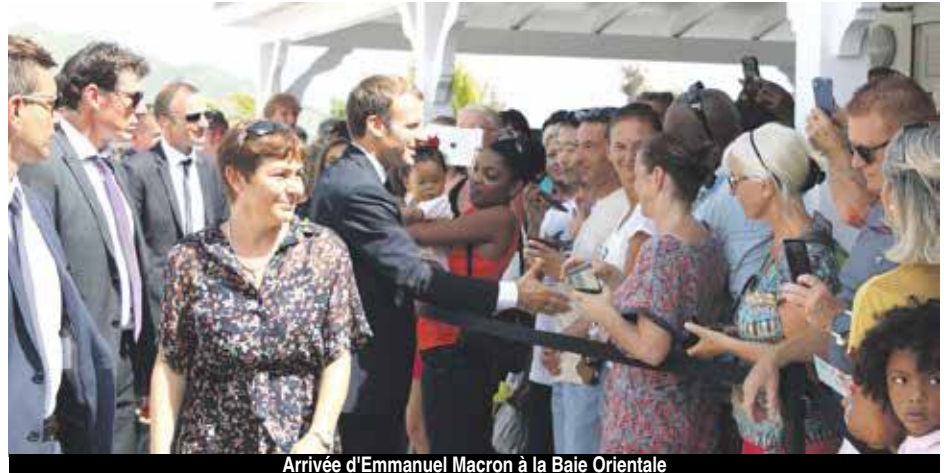
Arrivée d'Emmanuel Macron à la Baie Orientale

• Réponse de E. Macron : il faut être clair dans les choix. Payer pour évacuer, vous l'avez choisi, mais c'est une opportunité économique, il y a du business à faire, il faut y aller. Mais il y a aussi là un sujet d'éduca-