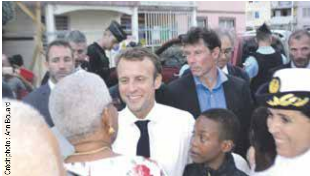
Le Chef de l'État à la rencontre des habitants de Quartier d'Orléans

La visite du Président de la République Emmanuel Macron ce week-end a été rythmée non pas par les différents points de rendez-vous qui étaient au programme, mais par les ressentis et émotions qui ont fait des montagnes russes.