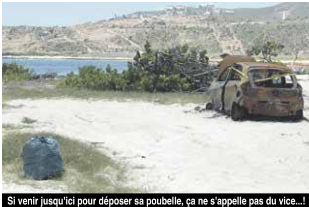
Si venir jusqu'ici pour déposer sa poubelle, ça ne s'appelle pas du vice...!

pourrait remplir les pages du journal avec la liste de toutes les incivilités en la matière. Et l'on ne parlera pas des gens peu scrupuleux qui viennent se servir en sable par sac entier, toujours sur la plage du Galion, qui rapelons-le est une réserve naturelle !