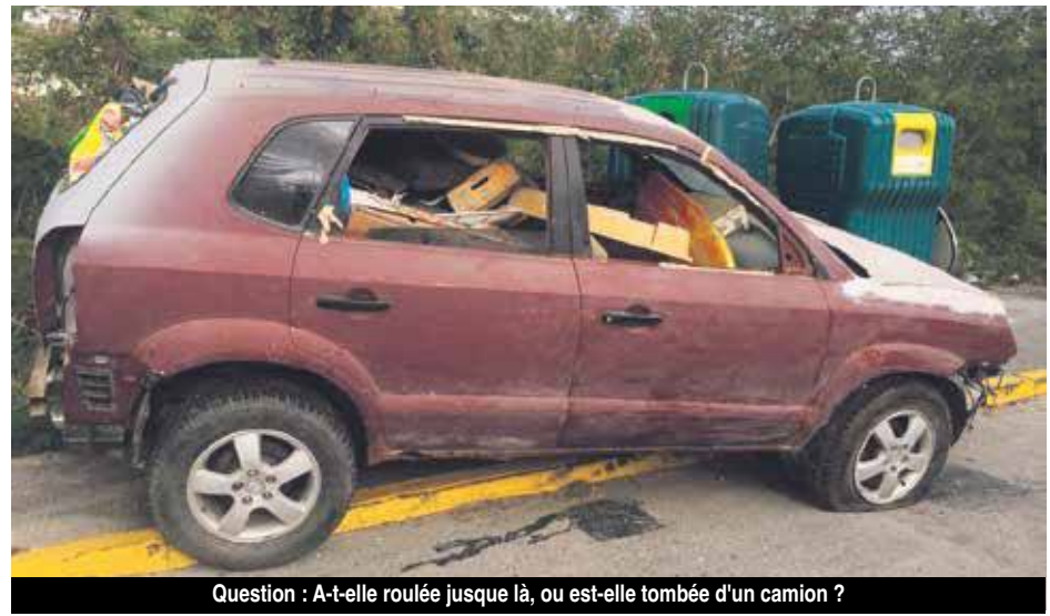
Question : A-t-elle roulée jusque là, ou est-elle tombée d'un camion ?