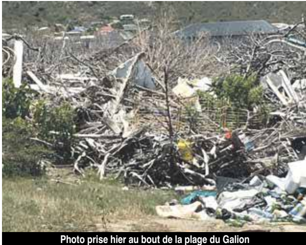
Photo prise hier au bout de la plage du Galion

Etre citoyen devrait s'accorder avec esprit civique et non avec crétin ... pour preuve, l'un des sites les plus naturels de la partie de l'île, en l'occurrence le Galion, est devenu au fil des semaines une déchetterie très populaire !