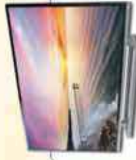
40" SAMSUNG SMART TV