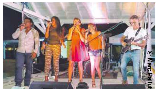
@ Marc Pallut