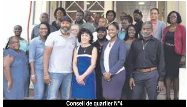
Conseil de quartier N°4

figure aussi celle de réaliser de vraies statistiques en matière, entre autres, d'associations et de besoins d'activités.