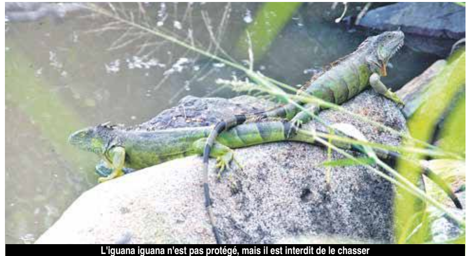
L'iguana iguana n'est pas protégé, mais il est interdit de le chasser