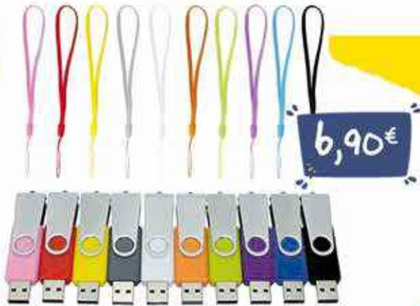
CLÉ USB À PARTIR DE 4GO