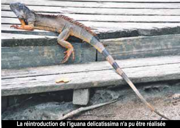
La réintroduction de l'iguana delicatissima n'a pu être réalisée