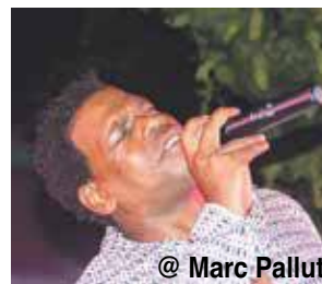
@ Marc Pallut

Vendredi dernier ce tenait la finale du « gros méchant casting » sur la place du village de la Baie Orientale.