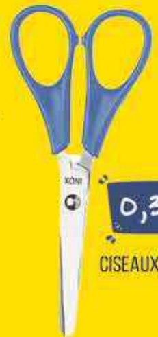
CISEAUX 13 CM