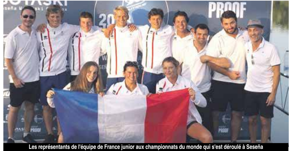
Les représentants de l'équipe de France junior aux championnats du monde qui s'est déroulé à Seseña