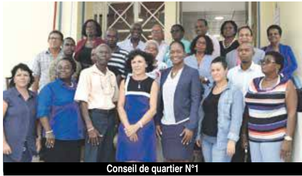
Conseil de quartier N°1