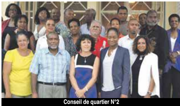
Conseil de quartier N°2

Le nouveau périmètre des conseils de quartier a été fixé par le conseil exécutif le 20 juin dernier, réduisant leur nombre de six à quatre. Par cette décision, la Collectivité souhaite que leur organisation réponde mieux à la structure du territoire et compte également optimiser les moyens de fonctionnement mis à leur disposition. Pour rappel, les membres des