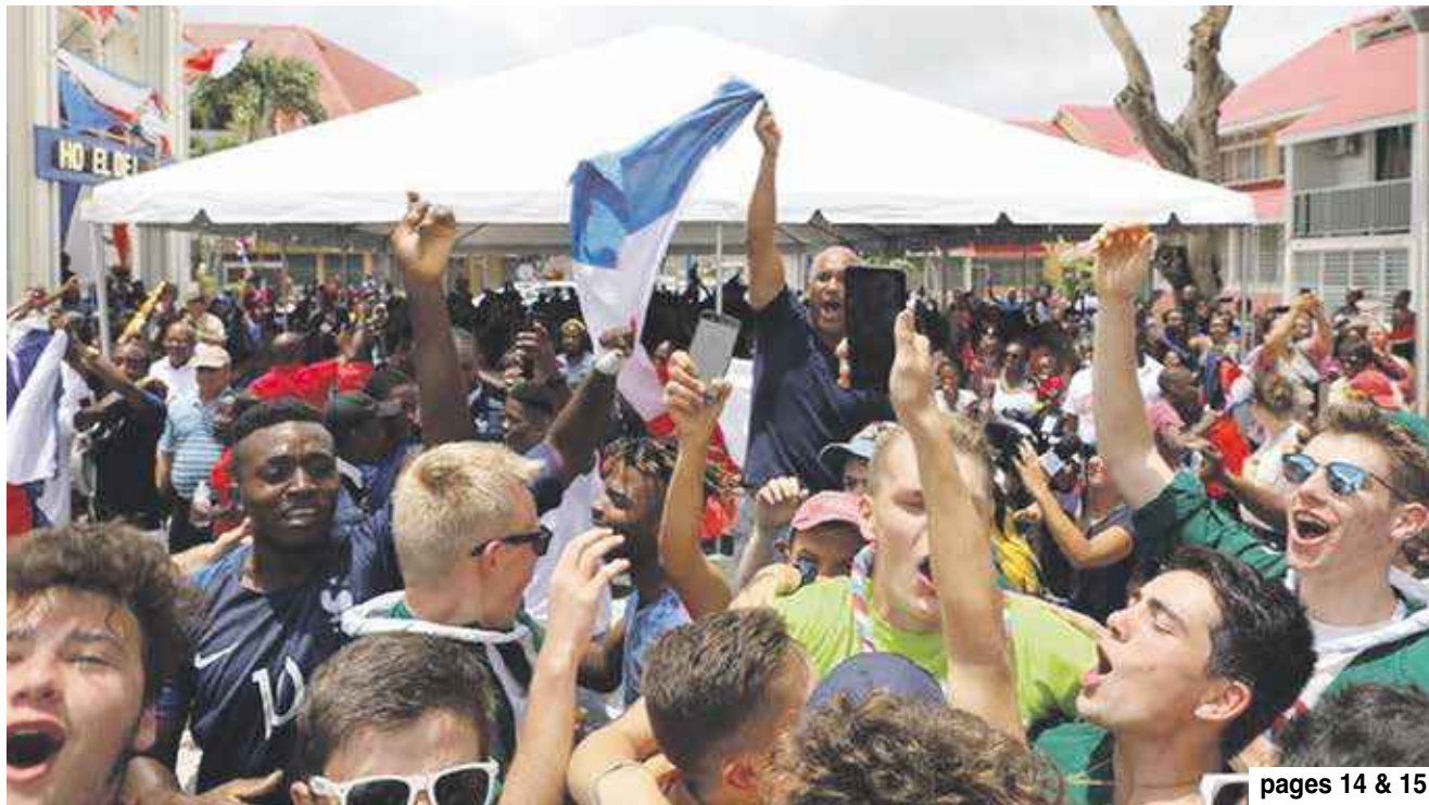
pages 14 & 15