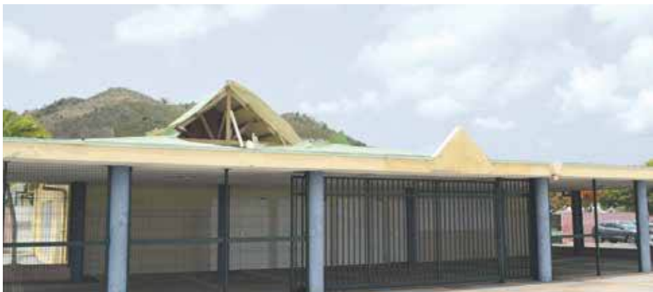
Les mois de l'été seront consacrés à la réalisation des travaux lourds sur le collège du Mont des Accords, notamment ceux de réparation des toitures. La fin des travaux pour cet établissement est prévue en fin d'année 2018.

La plus grande partie du budget prévu par la Collectivité pour la réparation des établissements scolaires sera consacrée aux établissements du secondaire, plus de 3.6 millions d'euros. Le Lycée Professionnel des Iles du Nord, à Marigot, la Cité scolaire Robert Weinum à la Savane et les collèges du Mont des Accords, de Quartier d'Orléans et de Soualiga (Cul de Sac) qui ont été extrêmement endommagés par l'ouragan, seront en travaux tout l'été. Le collège Soualiga ne sera pas reconstruit, certains de ses bâtiments encore debout seront restaurés pour y abriter dans l'avenir des services déconcentrés de la Collectivité.