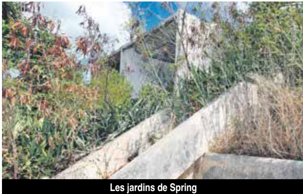
Les jardins de Spring

Vingt ans après, l'affaire de l'immeuble « Les Jardins de Spring » situé à Concordia est revenue sur le devant de la scène. Le dossier de l'immeuble, qui a été détruit de façon abusive et dans des circonstances rocambolesques, selon les copropriétaires, était à nouveau sur le bureau des magistrats de Basse-Terre ce jeudi 5 juillet 2018.