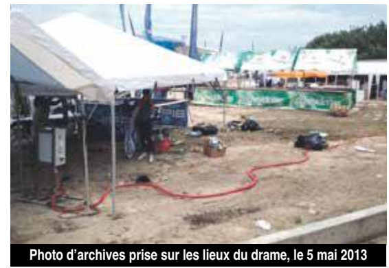
Photo d'archives prise sur les lieux du drame, le 5 mai 2013