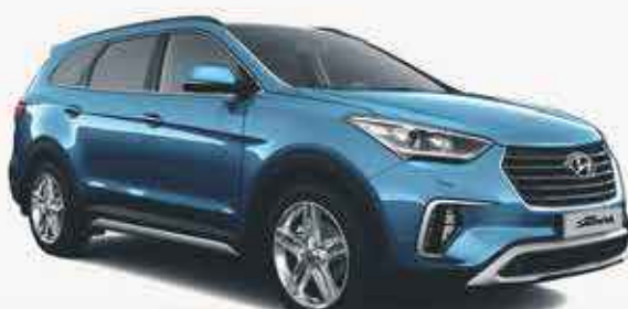
HYUNDAI GRAND SANTA FE