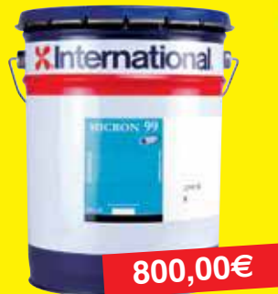
Antifouling, Micron 99 SPC Blue ou Blue-Navy 20L