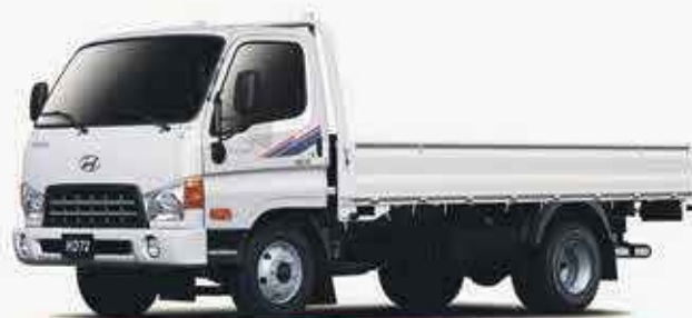
HYUNDAI HD65/75 CARGO

*Offre valable du 4 au 18 Juin 2018, sur nos modèles sélectionnés.