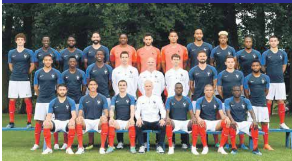
Photo officielle des 23 Bleus

La mascotte officielle de la Coupe du Monde 2018 est Zabivaka, un loup. En langue Russe, Zabivaka signifie « celui qui marque ». Le chanteur Jason Derulo a été choisi pour interpréter l'hymne officiel de Coca Cola pour la compétition et s'intitule Colors..