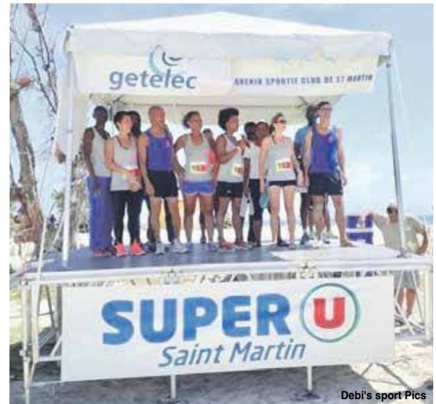
Debi's sport Pics