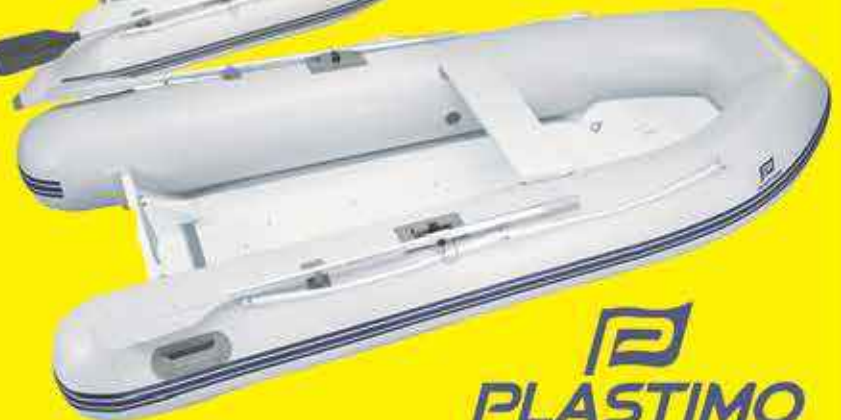
Annexe gonflable charter p270hh gris clair 1100,00€