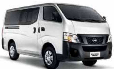
Nissan NV350 Urvan