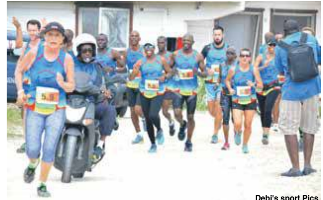
Debi's sport Pics

Région Guadeloupe et de Dream of Trail Arawak. Organisé par l'Avenir Sportif Club de Saint Martin et la SEMSAMAR, le RIE SXM 2018 s'est terminé sur une note d'au revoir et les équipes présentes ont d'ores et déjà pris rendez-vous l'année prochaine pour un peu de souffrance, de