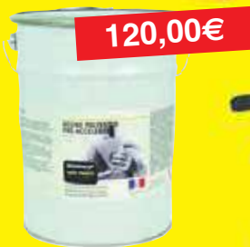
Résine Pré Accélérée Thixo 25kg