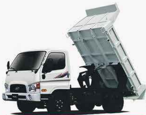
HYUNDAI HD 65/75 DUMP