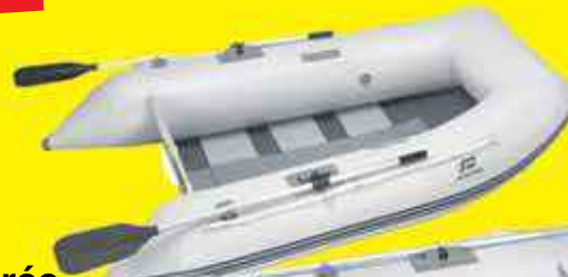
Annexe gonflable charter p240hh gris clair 895,00€