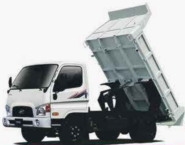
HYUNDAI HD 65/75 DUMP