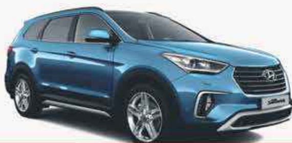
HYUNDAI GRAND SANTA FE