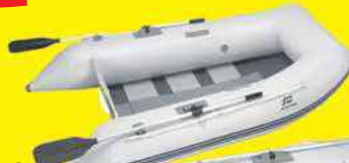
Annexe gonflable charter p240hh gris clair 895,00€