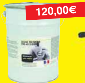
Résine Pré Accélérée Thixo 25kg