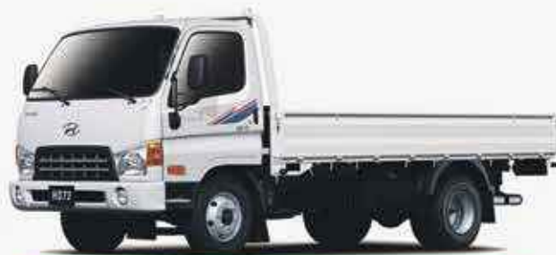
HYUNDAI HD65/75 CARGO

*Offre valable du 4 au 18 Juin 2018, sur nos modèles sélectionnés.