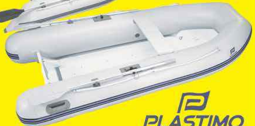
Annexe gonflable charter p270hh gris clair 1100,00€