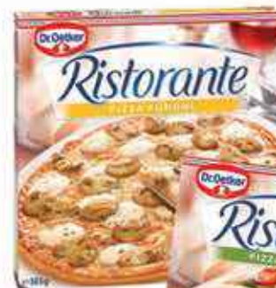
Pizza Dr.Oetker Ristorante Différentes Variétés 365G