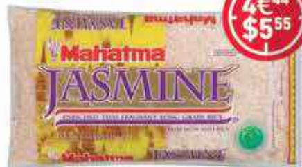
Riz Mahatma Jasmine 2.27 Kg