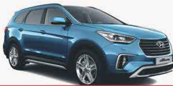
HYUNDAI GRAND SANTA FE