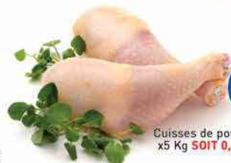
Cuisses de poulet entières x5 Kg SOIT 0,96€ LE KILO