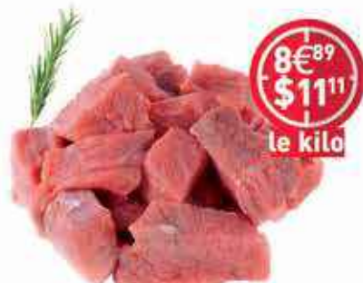
Boeuf USA Découpé en cube