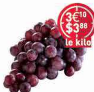
Raisin Red Globe sans Pépins