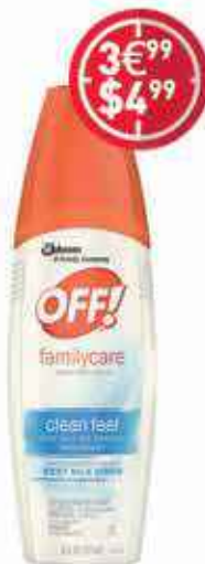
Spray Répulsif Moustique «Off» 177ml