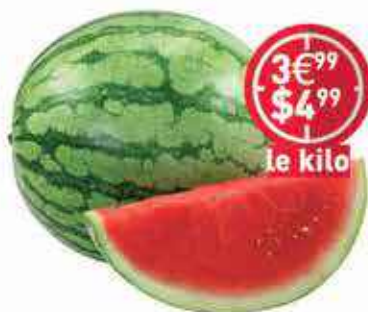
Pastèque USA sans pépins