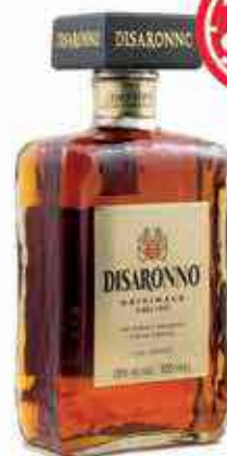
Disaronno Amaretto 1 Litre