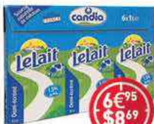
Candia Lait entier ou demi-écrémé 6X1l