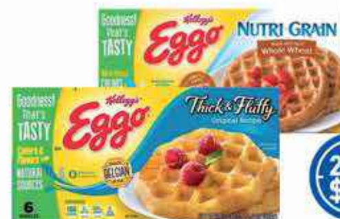
Kellogg's Waffles Différentes Variétés, 345G