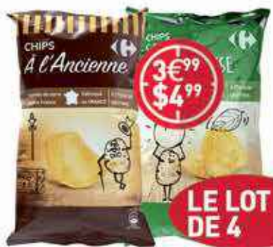
CARREFOUR Chips Classique 150 G (lot x 4)