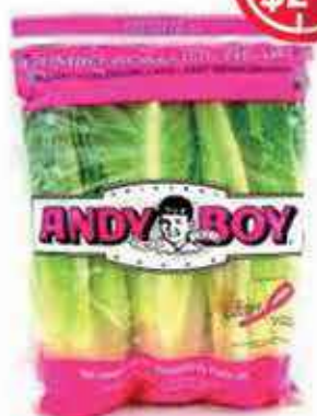
Salade USA Cœur de Romaine