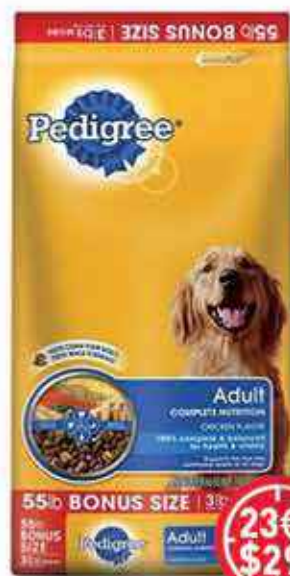
Croquette chien Pedigree 24.23 Kilos