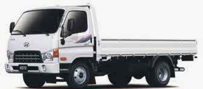
HYUNDAI HD65/75 CARGO

*Offre valable du 4 au 18 Juin, sur nos modèles sélectionnés.