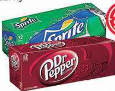
Sodas Sprite Dr Pepper Canettes 12 X 33 Cl