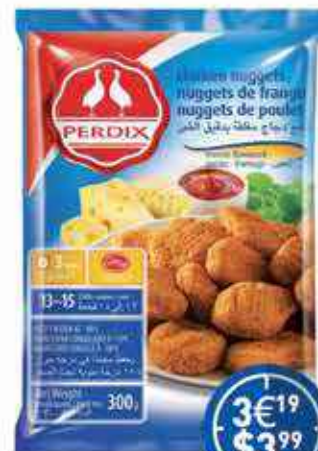
Perdix Chicken Nuggets 1Kg