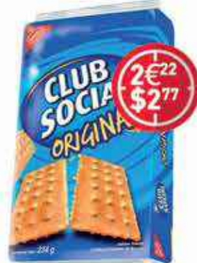
Club Social Original Crackers 234 G