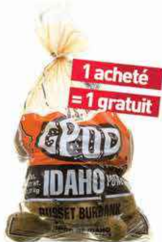
Pomme de terre USA sac de 2,27kg