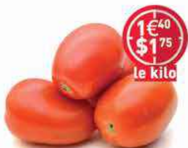
Tomate Plum St Domingue