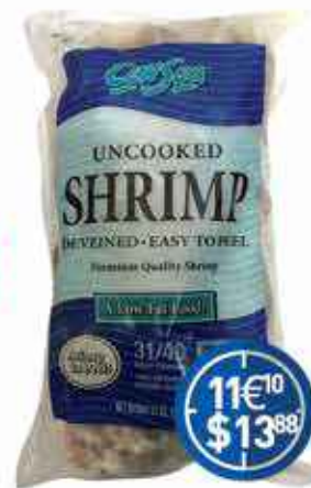
Crevettes Crues 881 g Surgelées Easy Peel