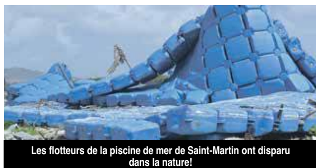
Les flotteurs de la piscine de mer de Saint-Martin ont disparu dans la nature!