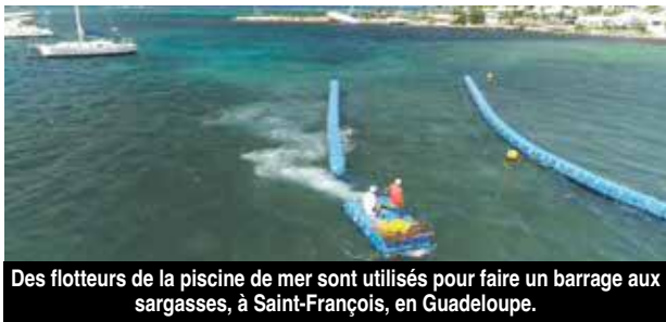
Des flotteurs de la piscine de mer sont utilisés pour faire un barrage aux sargasses, à Saint-François, en Guadeloupe.

Les brigades vertes s'attèlent chaque jour au ramassage des sargasses qui viennent s'échouer sur la côte est de l'île. « Ce sont 100 tonnes par jour qui sont évacuées », nous informait l'élue Pascale Alix Laborde, « Madame Environnement » de la Collectivité.