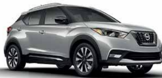
2018 Nissan Kicks

* Voir les conditions en concession. Offre valable jusqu'au 30 Avril 2018.