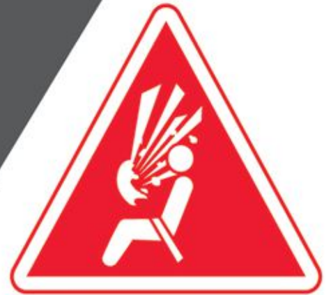
Airbag deployment with explosion*

Honda is committed to addressing your needs and concerns. We will provide a rental car FREE of charge if there are no replacement parts available to repair your vehicle.