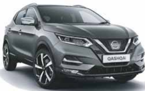
2018 Nissan Qashqai