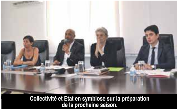
Collectivité et Etat en symbiose sur la préparation de la prochaine saison.