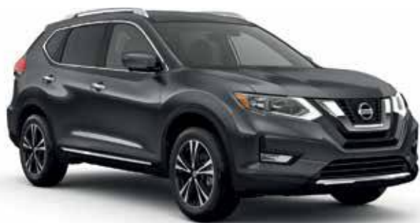
2018 Nissan X-Trail