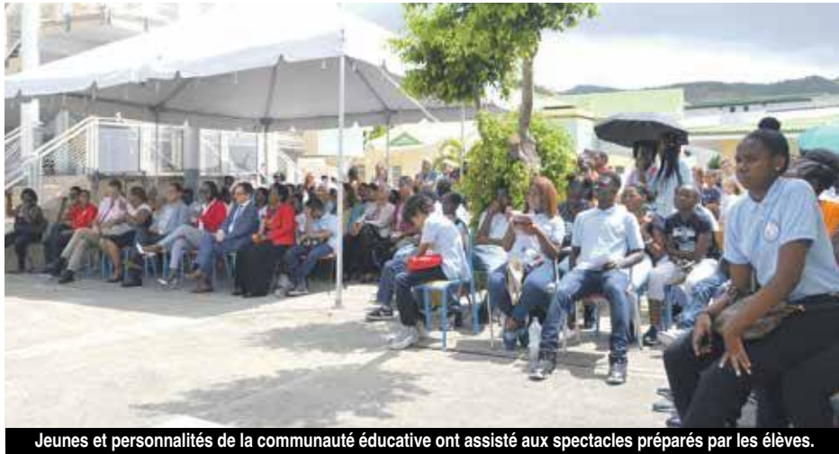
Jeunes et personnalités de la communauté éducative ont assisté aux spectacles préparés par les élèves.