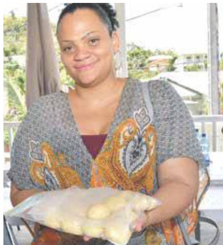
La satisfaction d'avoir réussi.