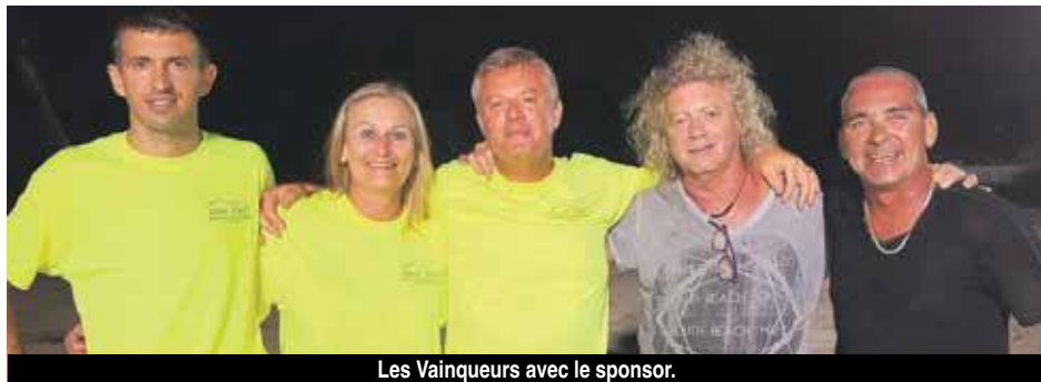
Les Vainqueurs avec le sponsor.

Ce premier grand Concours de la saison, doté de 1000€ de prix en espèces, sponsorisé par la Sté de Charpentes et Couvertures Dry Tec, aura connu un très beau succès, sur les terrains annexes au Sand Beach sur la Baie Nettlé.