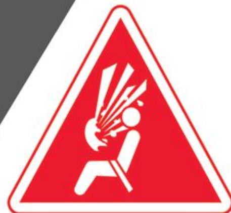
Airbag deployment with explosion*

Honda is committed to addressing your needs and concerns. We will provide a rental car FREE of charge if there are no replacement parts available to repair your vehicle.