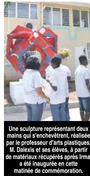
Une sculpture représentant deux mains qui s'enchevêtrent, réalisée par le professeur d'arts plastiques, M. Dalexis et ses élèves, à partir de matériaux récupérés après Irma, a été inaugurée en cette matinée de commémoration.

dénominateur commun à l'ensemble de ces représentations : l'histoire de l'île et l'ancrage de l'identité saint-martinoise, dans ses valeurs d'amitiés partagées du nord au sud de l'île. Une matinée tout en couleurs initiée par le Conseil territorial des Jeunes et l'ensemble de la communauté éducative de l'île. V.D.