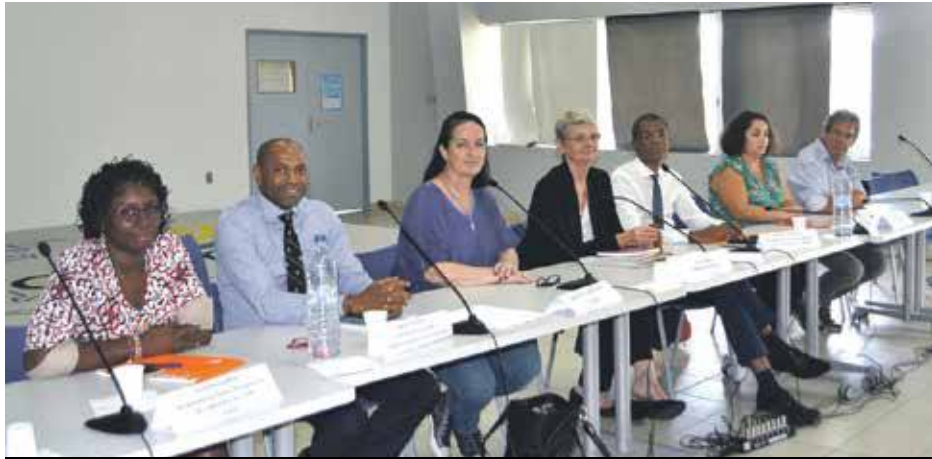
Experts comptables, mandataires et administrateurs judiciaires, représentant de la DIECCTE, commissaires aux comptes, les professionnels se mobilisent pour apporter conseils aux entreprises saint-martinoises.

Lundi matin, la CCISM invitait le tissu entrepreneurial de Saint-Martin à venir écouter les conseils de tout un panel de professionnels pouvant leur venir en aide dans cette difficile période post-Irma. Genèse d'un Guichet Conseils créé à l'initiative du conseil de l'ordre des Experts comptables de Guadeloupe, destiné aux entreprises. Un rendez-vous important pour les entreprises, lesquelles, pourtant, ne se sont pas présentées en nombre.