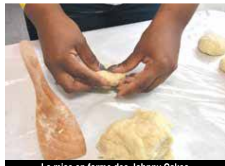
La mise en forme des Johnny Cakes.

la main. Si la pâte accroche, ajouter de la farine. Obtenir une consistance lisse. Mettre la pâte dans un bol, couvrir d'une serviette et laisser reposer 30mn.