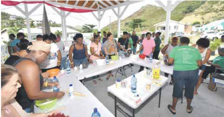
Début du 1 er atelier ... des élèves studieuses !

Soleil au beau fixe et ambiance familiale pour cette journée à Colombiers qui visait à réconcilier la population avec les recettes traditionnelles de la Caraïbe et plus particulièrement le Johnny Cake.