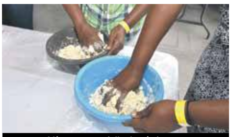
L'étape essentielle du pétrissage

Dans un saladier, tamiser farine, levure, sel et sucre. Ajouter le beurre et mélanger à la spatule ou avec les doigts. Ajouter l'eau et le lait. Pétrir à