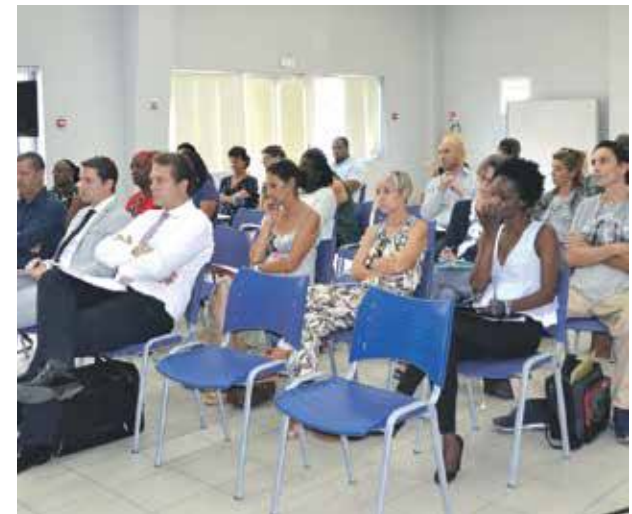
Une trentaine de chefs d'entreprises ont répondu présents à ce rendez-vous proposé par le Conseil de l'ordre des experts comptables de Guadeloupe.

L'objectif principal de ce dispositif est de maintenir les entreprises la tête hors de l'eau pendant cette délicate période post-Irma qui induit une activité ralentie, en leur apportant des réponses collégiales. V.D.