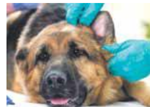
UN VIRUS DANS L'AIR

La clinique vétérinaire de Concordia nous annonçait 17 cas de maladie de Carré pour la seule semaine dernière : « Le plus gros épisode jamais vu ! », indique le vétérinaire, confirmant une très forte épidémie de cette maladie qui touche le chien, qui est extrêmement contagieuse et pour laquelle il n'y a pas de traitement efficace. « La mort du chien intervient à 90% des cas, seule la vaccination faite en prévention de la maladie protège l'animal », continue-t-il. Tous les animaux et a fortiori les chiots et les vieux chiens sont exposés à ce virus.