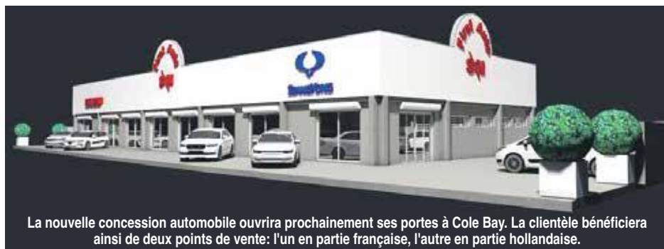
La nouvelle concession automobile ouvrira prochainement ses portes à Cole Bay. La clientèle bénéficiera ainsi de deux points de vente: l'un en partie française, l'autre en partie hollandaise.

Grand Case, dans la zone d'activités de l'Espérance, route de l'aéroport. Et très prochainement la concession automobile estampillée au nom des marques chinoises et coréennes ouvrira une seconde unité à Cole Bay : un show-room de plus de 300 m 2 dans un immeuble flambant neuf de 560 m 2 qui est actuellement en construction et dont les plans prévoient un large espace pour les ateliers mécaniques ainsi que le service après-vente, gage de sérieux et d'un professionnalisme hors pair, pour cette nouvelle concession.