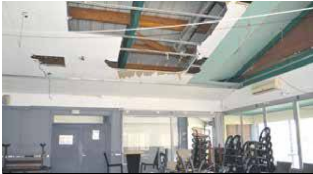
La salle de restaurant du Lycée professionnel toujours inutilisable par les élèves.

Si les ateliers pratiques et techniques du Lycée professionnel ne sont toujours pas utilisables à la rentrée des vacances de Carnaval, les élèves pourraient être envoyés dans des lycées professionnels de la Guadeloupe.