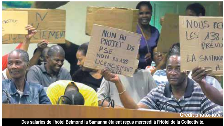
Des salariés de l'hôtel Belmond la Samanna étaient reçus mercredi à l'Hôtel de la Collectivité.

parallèlement, qui permettent à l'employeur de préserver ses employés avec une charge salariale réduite. Pour mémoire, dans ces dispositifs mis en place par l'Etat après Irma, il reste à la charge des employeurs 7 euros de l'heure par employé, le différentiel du salaire réel de l'employé étant pris en charge par l'Etat dans le cas où des formations sont mises en œuvre. Et modifiant pour Saint-Martin la règle des 1000 heures d'activité partielle par salarié, les employeurs devraient pouvoir bénéficier de ces dispositifs jusqu'à la prochaine saison touristique.