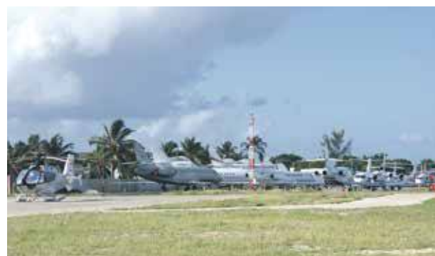
Fin décembre 2016, le tarmac de l'aéroport Juliana ne désemplissait pas des dizaines de jets privés stationnés là, le temps des fêtes.

Pour cette fin d'année un peu spéciale, le tarmac de l'aéroport Princess Juliana reste désespérément vide... Traditionnellement, chaque dernière semaine de l'année, il était le théâtre d'un ballet incessant de vols de jets privés.