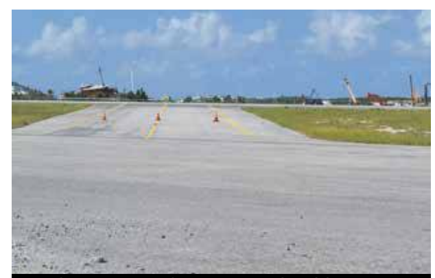
Décembre 2017, ce même tarmac reste désespérément vide...

Les années précédentes, à l'approche des fêtes de fin d'année, des dizaines de jets privés avaient pour habitude de stationner, à la queue leu leu sur le tarmac de l'aéroport Princess Juliana, sur des aires de parking spécialement prévues à cet effet. Si, pour la plupart d'entre eux, leurs passagers s'envolaient vers Saint-Barthélemy, le stationnement des jets privés à Sint Maarten générerait toutefois une belle manne financière pour