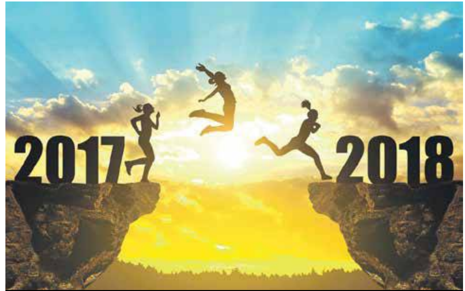
On y croit! Laissons 2017 derrière et regardons vers l'avenir... Toute l'équipe du 97150 vous souhaite d'excellentes fêtes de fin d'année.

Le gouvernement de Sint Maarten, en consultation avec le ministère des VROMI (sécurité et incendie), a donc décidé de limiter le type de feux d'artifice avec des fusées ne pouvant excéder 5 mètres de hauteur. Rafael A Boasman, le premier ministre de Sint-Maarten a indiqué que se-