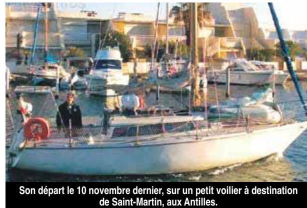
Son départ le 10 novembre dernier, sur un petit voilier à destination de Saint-Martin, aux Antilles.

Un marin-pêcheur du Grau-du Roi (Gard) est porté disparu depuis plus de 40 jours. Il avait embarqué à bord d'un petit voilier pour se rendre à Saint-Martin pour y travailler.