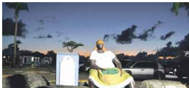
Depuis plusieurs mois, seule la "marchande" trône, impassible, sur le marché de Marigot. Avec le retour de quelques bateaux de croisière, certains vendeurs remontent leur stand, redonnant vie à un mini-marché.

Halte incontournable pour les touristes des bateaux de croisières, le marché de Marigot était quasi désert depuis plusieurs mois. C'était sans compter sur la détermination de quelques artisans locaux qui ont décidé de s'installer, le matin de 8h à 12h, les jours d'escales des bateaux.