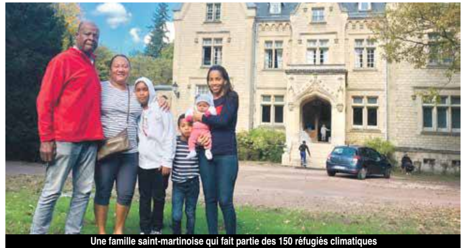
Une famille saint-martinoise qui fait partie des 150 réfugiés climatiques

Après avoir été hébergés pendant plus d'un mois dans des hôtels parisiens proches de l'aéroport d'Orly, 150 réfugiés climatiques en provenance de Saint-Martin ont été accueillis dans un hébergement collectif situé dans un château de l'Oise, à Coye les Forêts.