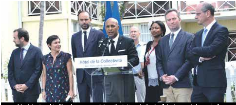
"Je n'ai qu'un objectif: redonner aux saint-martinois l'espoir d'un territoire innovant et prospère".