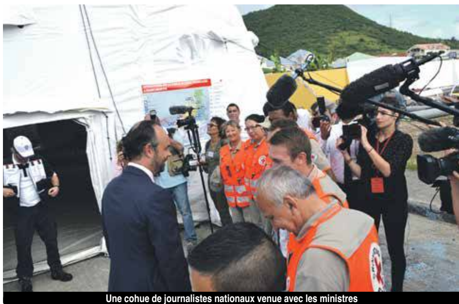
Une cohue de journalistes nationaux venue avec les ministres