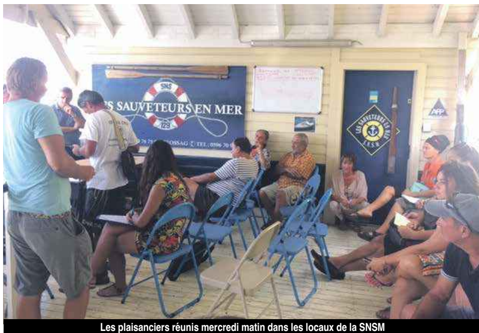
Les plaisanciers réunis mercredi matin dans les locaux de la SNSM

Pour mémoire, environ 1200 navires ont été impactés par l'ouragan Irma, dont 500 sont destinés à la destruction. Environ un tiers des bateaux qui ont coulé se situent dans le lagon de Simpson Bay, engendrant une pollution évidente. Mais pour retirer ces épaves, une condition sine qua non : la remise en fonction du pont de Sandy Ground... Là encore un autre sujet. V.D.