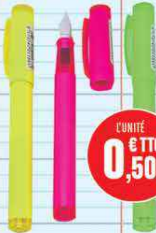
STYLO PLUME DIFFÉRENTS COLORIS