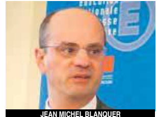
JEAN MICHEL BLANQUER