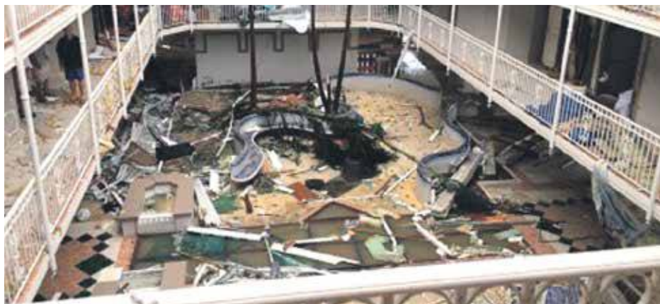
Le hall de l'hôtel Le Beach, après Irma