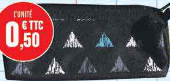
TROUSSE PREMIER PRIX