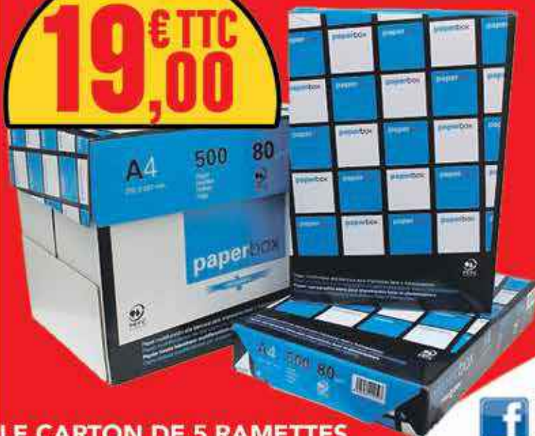
LE CARTON DE 5 RAMETTES

TOUTES LES CARTOUCHES D'ENCRE SONT ARRIVÉES