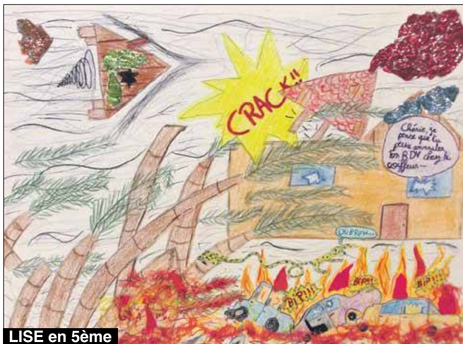
LISE en 5ème