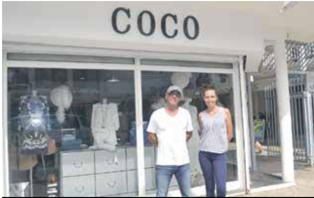
La boutique Coco de Marigot a rouvert le 17 octobre dernier. « Les chiffres sont au plus bas, pour autant nous sommes fiers d'avoir été parmi les premiers à rouvrir », raconte son gérant.