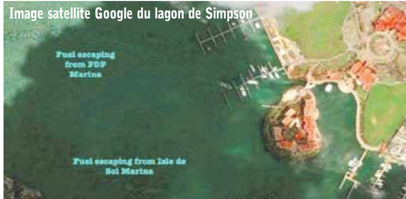
Image satellite Google du lagon de Simpson

« Si nous sommes aujourd'hui en mesure d'aider et de surveiller les opérations de sauvetage des bateaux échoués dans le lagon, nous sommes en attente des accords pris par le gouvernement pour récupérer les nappes de carburant et d'eaux usées », com-