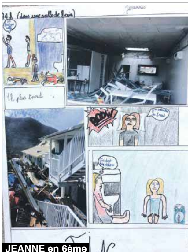
JEANNE en 6ème