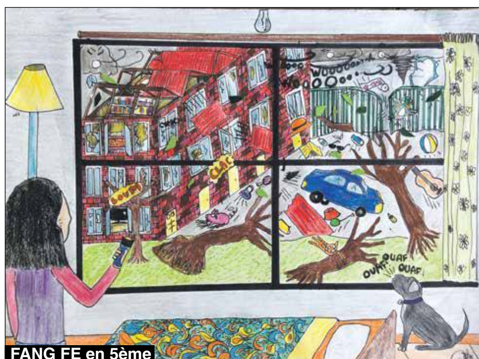
FANG FE en 5ème