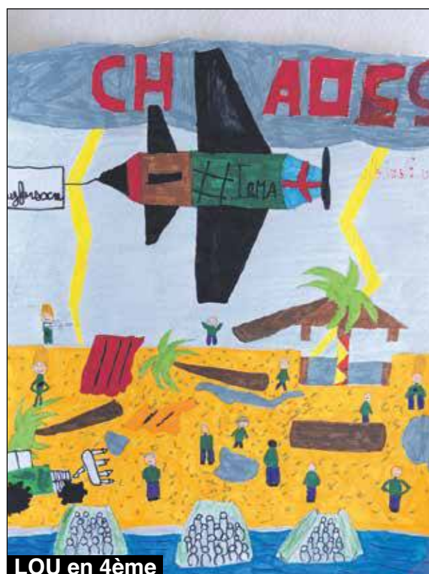
LOU en 4ème

naïfs, ces dessins d'enfants, une soixantaine, relatent cette histoire terrible vécue de l'intérieur. Ces dessins seront exposés dès lundi prochain sur les murs de l'établissement. Et vous retrouverez au fil de nos prochaines éditions la majeure partie d'entre eux. Bravo à tous ! Vous êtes formidables. V.D.