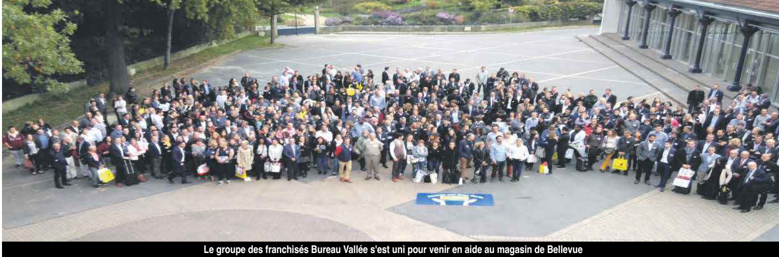
Le groupe des franchisés Bureau Vallée s'est uni pour venir en aide au magasin de Bellevue

Franchisée, l'enseigne Bureau Vallée, dont les deux magasins de Bellevue et de Hope Estate ont été d'abord endommagés par le passage de l'ouragan Irma, puis pillés comme tant d'autres commerces de l'île, a fait l'objet d'une forte mobilisation de solidarité de la part du groupe du même nom.