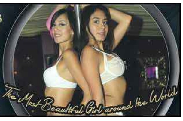
The Most Beautiful Girl around the World

Ask for special Birthday & Bachelor Parties, Private room Call 1 721 587 0055