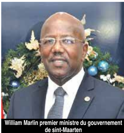
William Marlin premier ministre du gouvernement de sint-Maarten

Ceci étant, un échange dimanche dernier entre le premier ministre de Sint Martin, William Marlin et le ministre de l'Intérieur et des Affaires du Royaume des Pays-Bas Ronald Plasterk, fait état d'une mise au point quant à l'utilisation des fonds qui seront débloqués. Le gouvernement hollandais demanderait au préalable la création « d'une chambre d'intégrité » contrôlée par les Pays Bas, permettant de vérifier l'utilisation des fonds. William Marlin a estimé dimanche après-midi que le gouvernement néerlandais retenait ainsi en otage la population de Sint Maarten sur la question de la