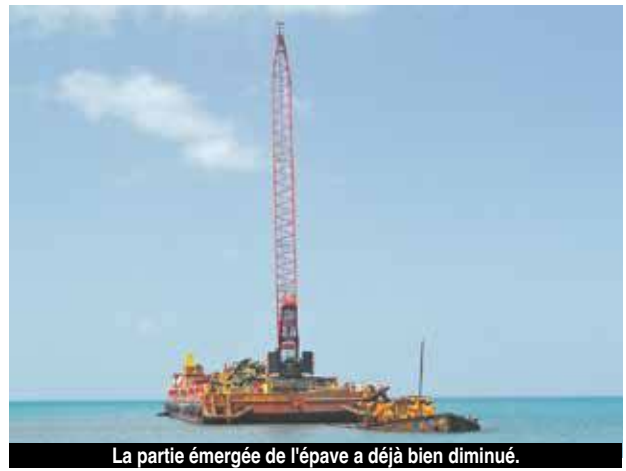
La partie émergée de l'épave a déjà bien diminué.