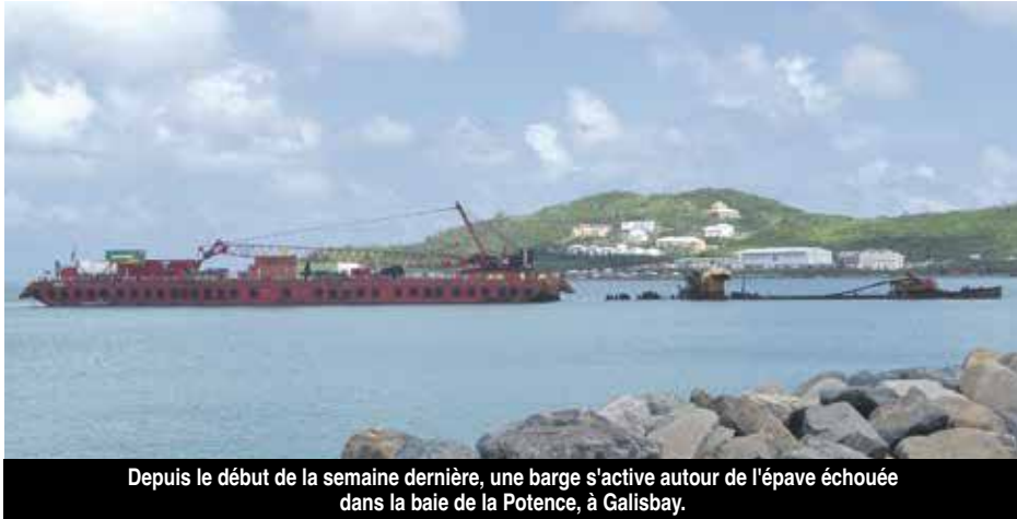
Depuis le début de la semaine dernière, une barge s'active autour de l'épave échouée dans la baie de la Potence, à Galisbay.

Depuis le début de la semaine dernière, une barge s'attèle autour de l'épave El Maud. Ce bateau jaune échoué dans la baie de Galisbay en 1999, suite au passage de l'ouragan Lenny, et dont l'épave depuis cette date fait partie du paysage, au point même d'être devenu un spot de plongée, est en train de vivre ses dernières heures.