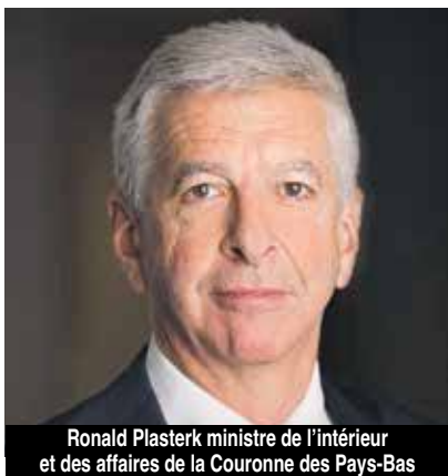
Ronald Plasterk ministre de l'intérieur et des affaires de la Couronne des Pays-Bas

Alors que la partie sud de l'île est en pleine négociation avec le gouvernement des Pays Bas concernant le montant de l'aide nationale pour la reconstruction, les autorités néerlandaises semblent en préambule vouloir imposer une règle d'intégrité, afin de rendre traçable les fonds qui seront débloqués.