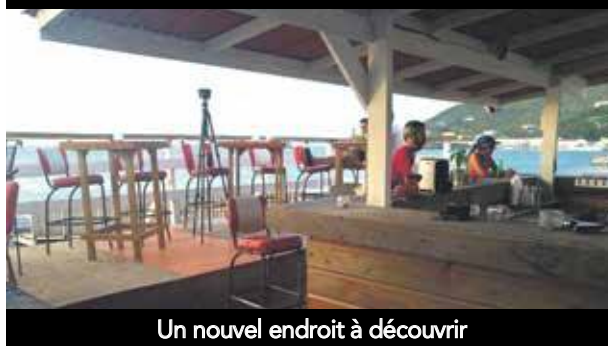
Un nouvel endroit à découvrir