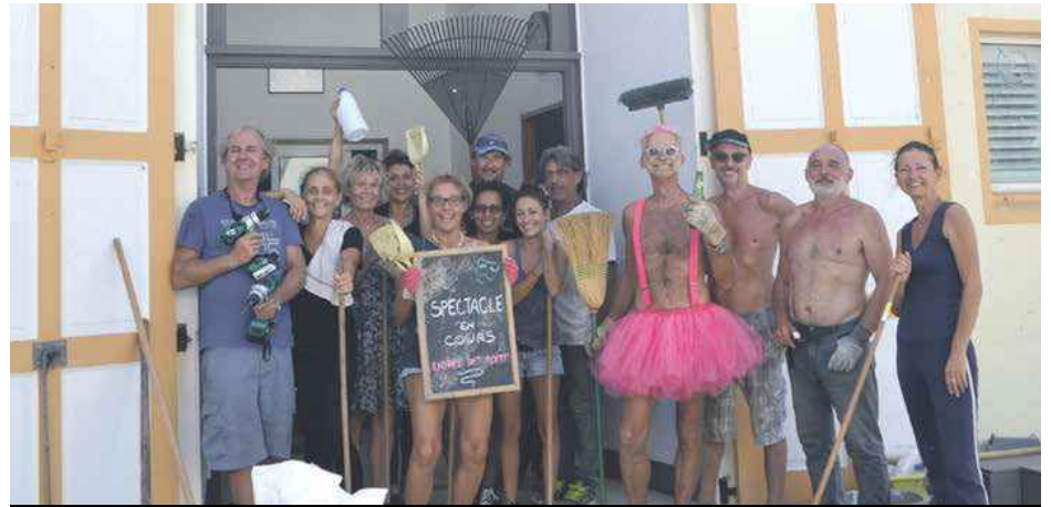
Dans la bonne humeur, une vingtaine de personnes s'est retrouvée samedi matin pour redonner aux lieux la splendeur d'avant Irma.