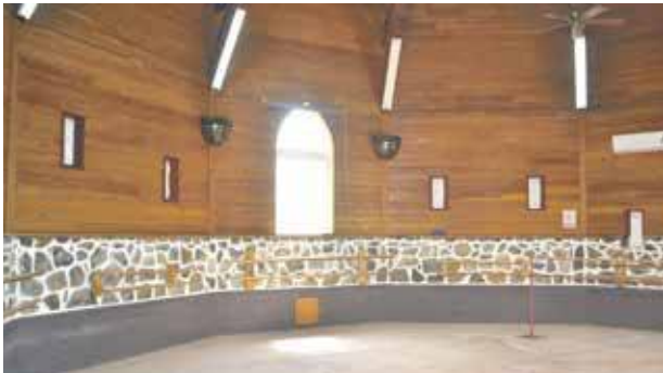
Cette superbe salle qui peut accueillir une cinquantaine de personnes est offerte à la location. L'association étudie toutes propositions

Les stades et autres complexes sportifs du territoire sont pour l'heure inaccessibles. Or, pour leur bien-être mais aussi leur mental, les enfants ont besoin d'avoir à nouveau accès à leurs activités sportives et culturelles. Plus vite les opérations de réparations de nettoyage auront lieu et plus vite le cours de la vie pourra reprendre. Temps Danse Académie s'y active.