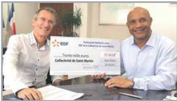
VISITE DE NOEL LE GRAËT, PRÉSIDENT DE LA FÉDÉRATION FRANÇAISE DE FOOTBALL

Cette convention a été signée pour une durée de deux ans ; EDF a fait don de la somme de 30 000€ pour acter ce partenariat solidaire au bénéfice des Saint-Martinois en précarité énergétique.