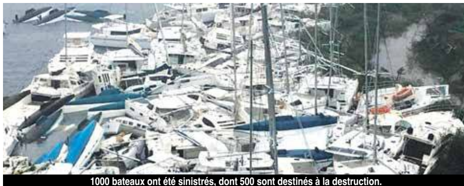
1000 bateaux ont été sinistrés, dont 500 sont destinés à la destruction.