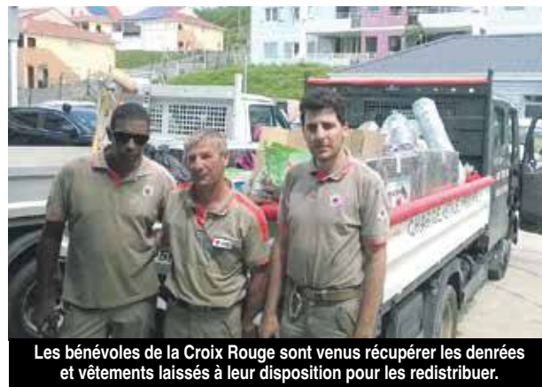
Les bénévoles de la Croix Rouge sont venus récupérer les denrées et vêtements laissés à leur disposition pour les redistribuer.

s'est rendue à la brigade de Marigot pour venir récupérer une partie du matériel saisi lors des perquisitions, soit non réclamé par leurs propriétaires, soit laissé à disposition. Les bénévoles de la croix rouge ont ainsi chargé des produits alimentaires secs, des vêtements, des choses de premières nécessités qui seront donnés aux personnes nécessiteuses et qui ont le plus souffert de l'ouragan.