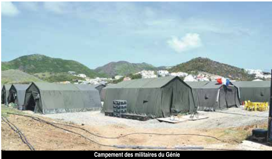
Campement des militaires du Génie

C'est le 15 octobre prochain que les militaires et les 1000 tonnes de matériel devraient repartir à bord du BPC Tonnerre. Ils seront restés trois semaines sur le territoire... V.D.