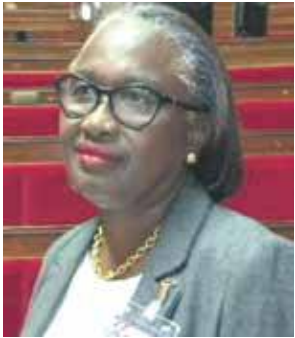
CI-DESSOUS, QUESTIONS ET RÉPONSE.

Mercredi 4 octobre dernier, la députée Claire Javois intervenait dans l'hémicycle de l'Assemblée Nationale, dans les questions au gouvernement sous l'intitulé : « Soutien à la reconstruction de Saint-Barthélemy et de Saint-Martin ». Alors que la députée interpellait le Premier ministre sur des aides immédiates de l'Etat concernant les moratoires en matière de paiement des charges sociales ainsi que sur les aides financières et fiscales pour aider à la relance de l'activité économique, le Premier Ministre a botté en touche, ramenant le débat sur des mesures sur du plus long terme et qui concernent essentiellement la cartographie de prévention des risques pour la reconstruction de l'île. Un nouveau discours de sourds entre l'Etat et Saint-Martin... V.D.