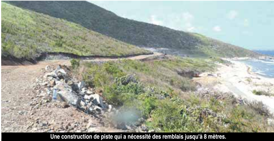
Une construction de piste qui a nécessité des remblais jusqu'à 8 mètres.

Le génie militaire (17ème RGP et 19e RG) débarqué du Bâtiment «Tonnerre» le samedi 23 septembre dernier sur la plage de Friar's Bay a pris ses quartiers sur un terrain en bordure de lagon, à proximité de la station Cadisco, sur la route de la Baie Orientale.