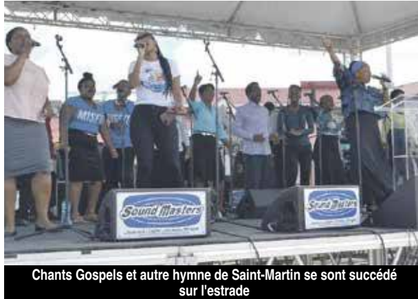
Chants Gospels et autre hymne de Saint-Martin se sont succédé sur l'estrade

d'insister : « Je ne lâcherai rien et nous obtiendrons une compensation financière à la hauteur de la catastrophe qui s'est abattue sur nous. Je ne me laisserai pas séduire par les mots, mais convaincre par les actions ». V.D.