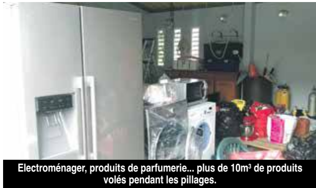
Electroménager, produits de parfumerie... plus de 10m 3 de produits volés pendant les pillages.

La Gendarmerie a effectué plus de 110 perquisitions depuis le début des événements. Ces derniers jours, neuf personnes ont été mises en garde à vue parmi lesquelles cinq ont été déférées.