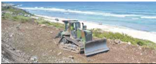
Une plateforme de réception des ordures ménagères est en cours de finalisation. Une autre plateforme pour réceptionner les épaves de véhicules sera également construite.

Ils sont aujourd'hui encore une centaine d'hommes à travailler sur les chantiers de la reconstruction, sur réquisitions de l'Etat. Parmi les chantiers, celui titanesque de la réalisation à Cul de Sac d'une piste surélevée pour accéder à la décharge de Grandes Cayes. D'une longueur de 1800 mètres, la piste qui atteint jusqu'à 8 mètres de large a