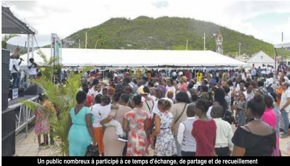
Un public nombreux à participé à ce temps d'échange, de partage et de recueillement