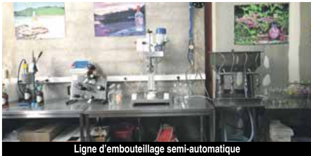
Ligne d'embouteillage semi-automatique