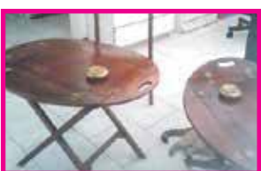
TABLE BASSE : marine. Prix : 350 €

BANC EN BOIS SCULPTÉ : Banc en bois sculpté. Prix : 130 €