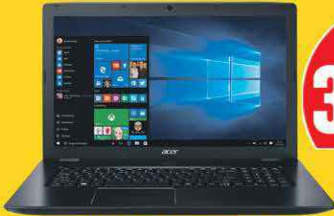
ORDINATEUR ACER ASPIRE ES1-553