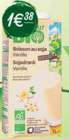
Boisson au soja vanille Carrefour Bio 1 L

Tel : (001 721) 544 41 44 Union Road COLE BAY Ouvert du lundi au samedi 8h - 20h - Le dimanche 9h-14h