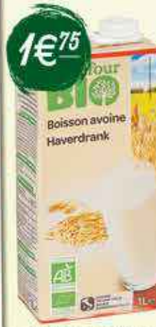
Boisson avoine Carrefour Bio 1 L