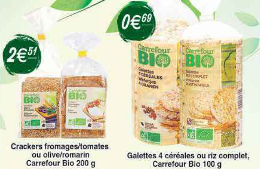
Crackers fromages/tomates ou olive/romarin Carrefour Bio 200 g