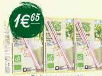
Boisson au soja vanille Carrefour Bio 3 x 25 cl