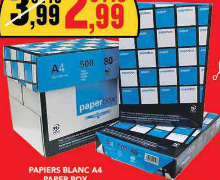
PAPIERS BLANC A4 PAPER BOX