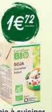
Soja à cuisiner Carrefour Bio 25 cl