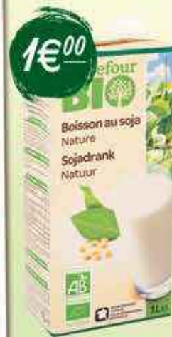
Boisson au soja nature Carrefour Bio 1 L