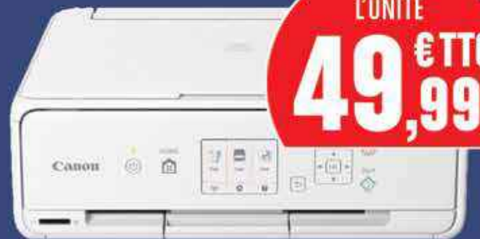
IMPRIMANTE CANON MG4250, JET D'ENCRE, IMPRESSION COULEUR, COPIEUR, SCANNER