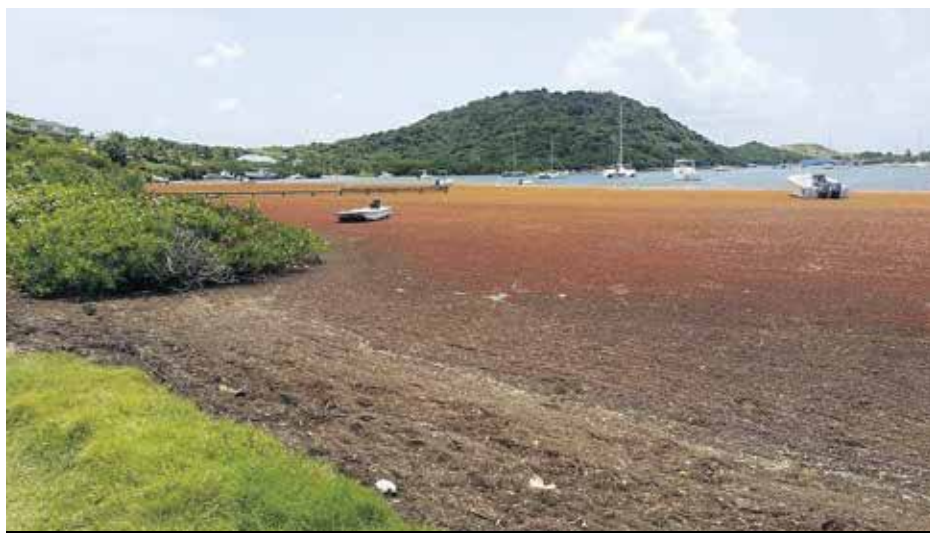
La nappe de sargasses qui s'étend au delà de l'extrémité du ponton de l'embarcadère de Cul de Sac empêche les bateaux des passeurs d'accoster.

Les passeurs de Pinel ont donc pris la décision ce week-end de stopper toute activité. Entraînant de fait, et faute de clientèle arrivant sur l'île, la fermeture temporaire et pour une période indéterminée des deux restaurants de l'île Pinel. Une première conséquence économique directe du fléau des sargasses en cette période, certes dite de