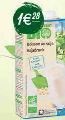
Boisson au soja calcium Carrefour Bio 1 L