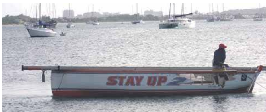
Le voilier Stay Up a été secouru par la SNSM pendant les festivités de ce week-end.

Mais, le 15 juillet, deux voiliers se sont gravement percutés, lors du virement de la première bouée au large de la Belle Créole. Heureusement, la Rescue Star et ses équipiers bénévoles étaient sur place et ont pu remorquer, de façon